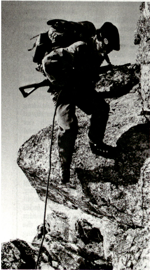
Der Überraschungseffekt im Jagdkampf ist von entscheidender Bedeutung

diverse Eignungstests statt. Ungenügende Teilnehmer werden aus dem Kurs entlassen. Nach dieser Phase werden die Teilnehmer in zwei Detachements aufgeteilt. Det I begibt sich je nach Witterungsverhältnissen in einen zugewiesenen Raum (Diavolezza, Bergell usw.) und betreibt unter der Anleitung der «Ausbilder Geb Ausb» die Gebirgsausbildung. Det II verschiebt sich in den Raum Bernina Hospiz oder La Rösa und absolviert die Ausbildung im Gebirgskampf. Mitte WK wechseln die Teilnehmer der beiden Detachements die Standorte. Die Ausbilder bleiben auf ihren Stützpunkten.