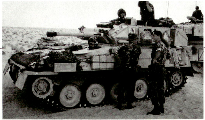
Schützenpanzer Scorpion der «Royal Scots Guard» in der saudischen Wüste.