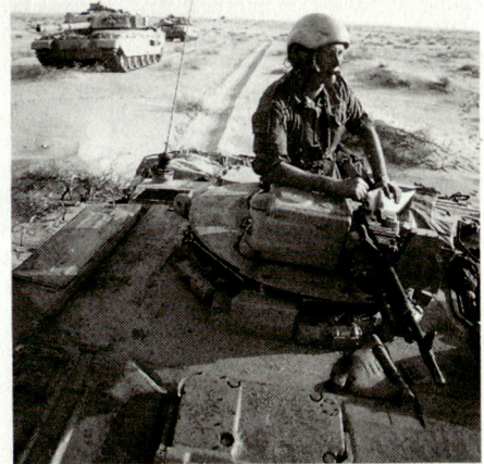
Kommandant eines Challenger 1; dieser Panzertyp soll sich im Golfkrieg ausgezeichnet bewährt haben.

gaden werden neu je 2 Panzer und je 2 Mech Inf Regimenter umfassen. Bei der Artillerie wird neu das Selbstfahrgegeschütz 155 mm AS90 anzutreffen sein, was eine merkliche Steigerung der Feuerkraft bedeutet.