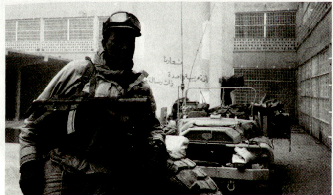
Ein französischer Fernaufklärer im Innern der Festung As Salman, wo sich ein irakisches Divisions-Hauptquartier befand.