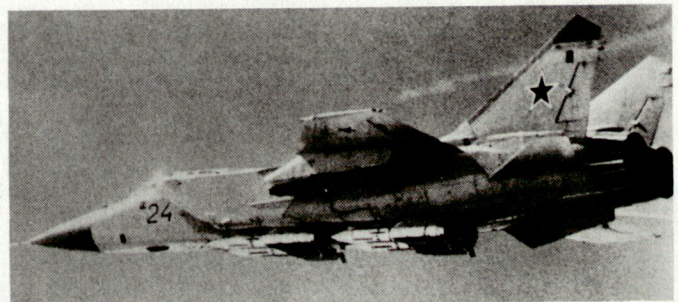
MiG-31 der ehemaligen Sowjetluftwaffe mit Lenkwafern AA-9-Amos.

Daneben verfügt der Iran immer noch über einen Restbestand von westlichen Flugzeugen, wie Phantom F-4 und Grumman F-14. Dazu kommen etwa 120 irakische Kampfflugzeuge sowjetischer sowie chinesischer Bauart, die während des Golfkrieges in den Iran überflogen wurden. Obwohl mit Tarnnetzen abgedeckt, wird dieses Fluggerät heute nur noch über eine geringe Flugfähigkeit verfügen. RCB