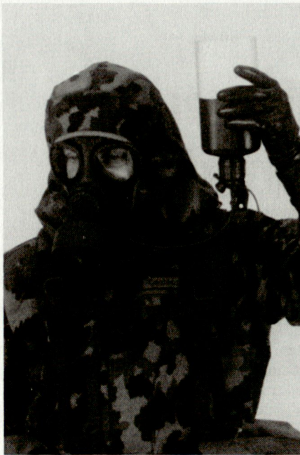
ABC-Schutzmaske 90 mit Trinkvorrichtung

6. Im Vorspann des Symposiums fand eine Orientierungsversammlung der UN-Spezialkommission UNSCOM für die Vernichtung des iraki-