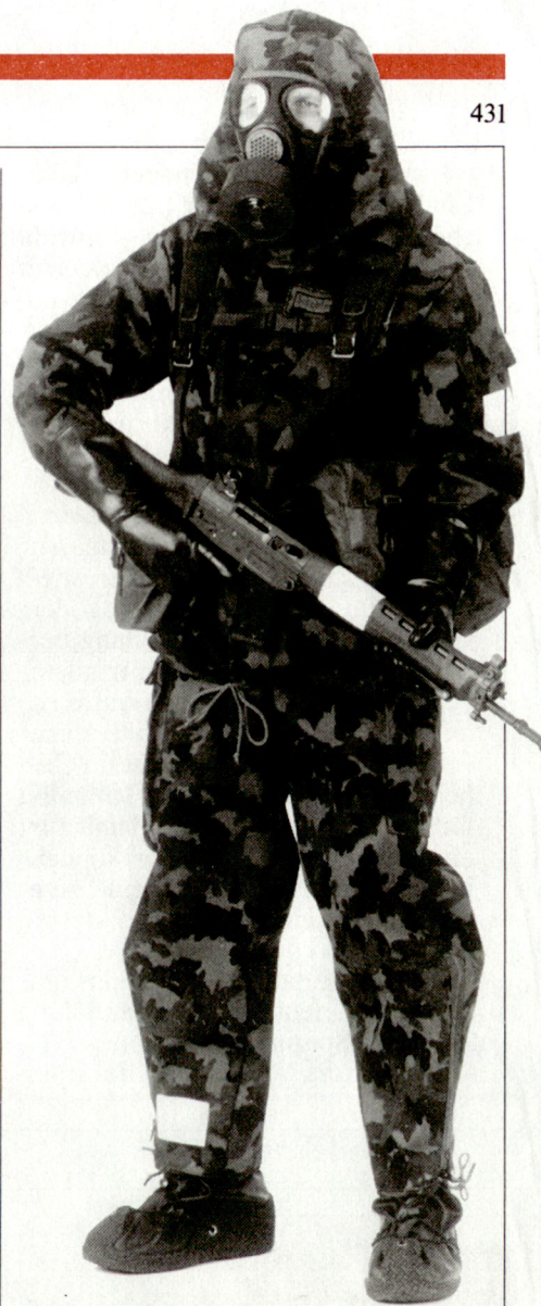
C-Schutzanzug 90 (C-Vollschutz)

2. Für den Berichterstatter zeigte sich erneut eine gewisse, nicht vermeidbare Problematik: Die sich an der Praxis messenden Referate waren eher dünn gesät. Diesbezüglich stachen die