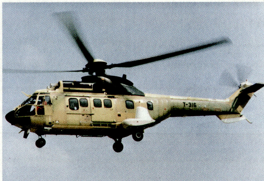
Super Puma (noch ohne Anstrich)