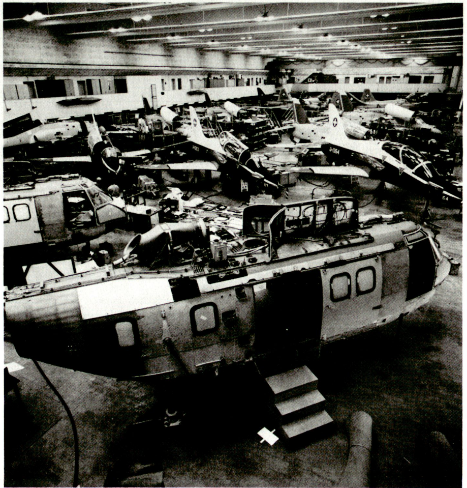
Montagehalle. Vorne Super Puma, hinten Hawk Jettrainer

■ Das direkte Programm (SIP) hat einen Umfang von 311 Mio. Franken; davon wird ein Anteil für gegen 1600 Mannjahren arbeitswirksam in der Schweiz. Die 311 Mio. enthalten unter anderem auch die Kosten für die Übernahme der Lizenzen, Werkzeuge und Einrichtungen sowie die Instruktion des einheimischen Personals für den Aufbau einer Industriebasis.