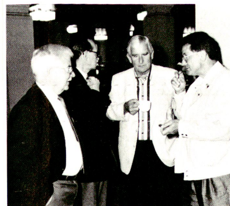
Gespräche bei der Kaffeerrunde