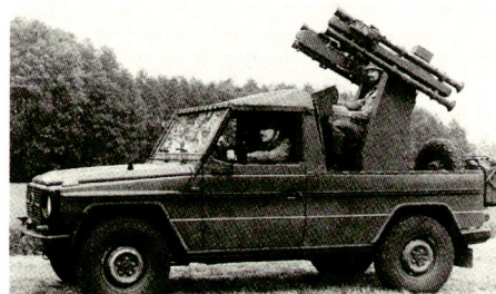
Aus Soldat und Technik 5/1993

soll die Krisenreaktionskräfte vor Angriffen aus der Luft schützen. Der Waffenträger, auf dem ein Abschussgestell für vier STINGER montiert sein wird, soll in einer CH-53 luftverladbar sein. Ob dafür besser ein Radfahrzeug oder ein Kettenfahrzeug geeignet erscheint, wird bis zur Billigung einer Taktisch-technischen Forderung (TTF) abschliessend bewertet. Je fünf Waffenträger bilden mit einer Aufklärungs- und Feuerleiteneinheit einen autonomen Zug. Drei Züge werden in einer Batterie mit Verbindungstrupps