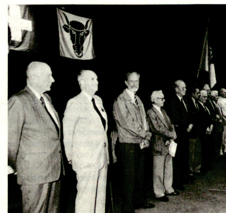
Die neuen Ehrenveteranen. Im Vordergrund alt Ständerat Franz Muheim

In seinem Bericht hielt der Zentralobmann kurz Rückschau auf vergangene Geschäfte der Vereinigung. Aus Anlass des 100jährigen Bestehens des UOV Baden wurde die nächste Tagung auf den 11. Juni 1994 in Baden festgelegt. Zum Mitgliederbestand wusste Jules Faure zu berichten, dass gegenüber dem Vorjahr eine Erhöhung um 257 Mitglieder auf neu 5233 stattfand.