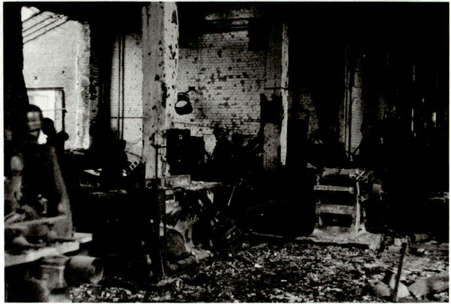
Deutsche Infanterie in den Ruinen einer eroberten Geschützfabrik in Stalingrad am 17. Oktober 1942*

Ende Dezember war die 6. Armee im Kessel für begrenzte Zeit noch beschränkt kampffähig. Der Grund waren die laufenden Verluste und