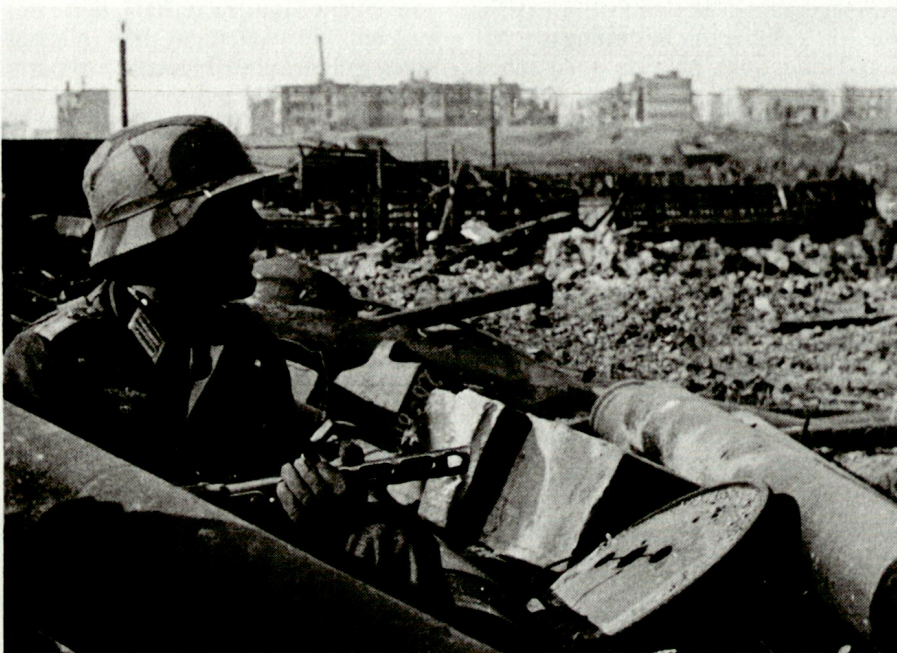
Oft wird der Kampf in den Ruinen im Einzelgefecht geführt.*

Sinngemäss führte F. Paulus aus, dass für die Zeit von Weihnachten 1942 bis zum Grossangriff der Russen am 10. Januar 1943 bezeichnend gewesen sei, dass einerseits der 6. Armee immer noch und immer wieder die Befreiung mit Bestimmtheit in Aussicht gestellt wurde, und dass andererseits die Armeeführung im Kessel sich nach wie vor mit Überlegungen und Massnahmen hinsichtlich eines Ausbruchs befasste. Der Niedergeschlagenheit von Ende Dezember folgte keineswegs eine völlige Resignation. Zu dieser Tatsache hat beigetragen, dass dem Armeoberkommando die sogenannte