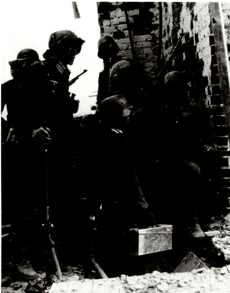
Hinfort wird nur noch in und um und aus Ruinen gekämpft.*

Nach dem Scheitern der Entsatzversuche und Ausbleiben der versprochenen Hilfe handelte es sich lediglich um Zeitgewinn, um den Neuaufbau des Südteils der Ostfront und die Rettung der im Kaukasus stehenden starken deutschen Kräfte zu ermöglichen. Gelang dies nicht, so war der Gesamtkrieg allein schon durch die zu erwartenden Ausmasse bei einer Niederlage an der Ostfront verloren. Die vorgesetzten Dienststellen vertraten daher nun selbst das Argument, dass es gelte, durch «Ausharren bis zum Aussersten» das Schlimmste für die Gesamtfront zu verhüten. Damit spitzte sich die Frage des Widerstandes der 6. Armee bei Stalingrad auf folgendes Problem zu: So wie die Lage sich mir darstellte und noch mehr, wie sie mir dargestellt wurde,