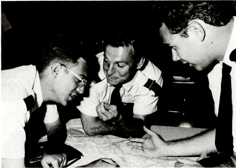
Diskussion über das Ergebnis einer Übung mit Landeskarten: Aspiranten der Stabssekretär-Offiziersschule während ihrer Ausbildung.

Sport und Pistolenausbildung haben im Ausbildungsplan ebenfalls einen hohen Stellenwert.