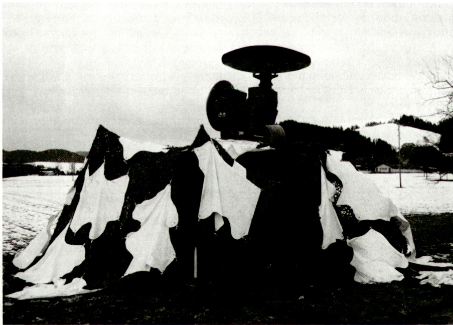
Système de conduite de tir 75 «Skyguard»

tefois être attribués ou subordonnés aux futures brigades blindées... A l'échelon opératif, il appartient au commandement de l'armée de fixer des priorités et de régler l'attribution des moyens DCA, capables de combattre de nuit.»