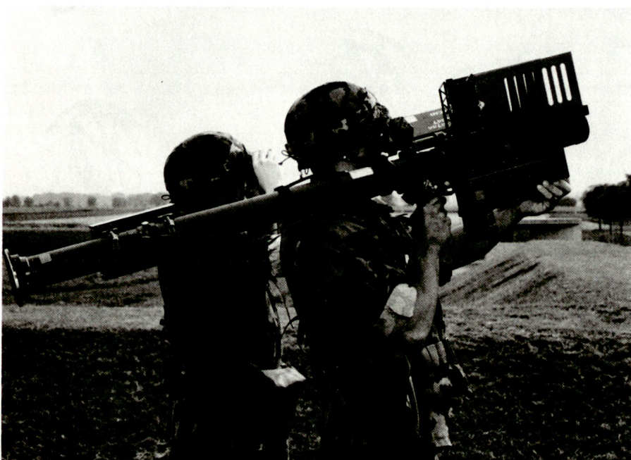
Système «Stinger»