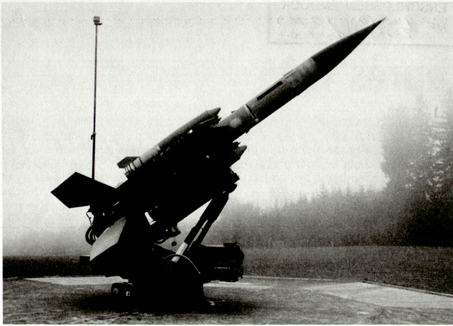
Système «Bloodhound» BL-64