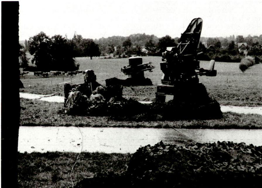
Système «Rapier»

* Voir à ce sujet l'article consacré à la munition AHEAD dans le numéro 1/94 de l'ASMZ.