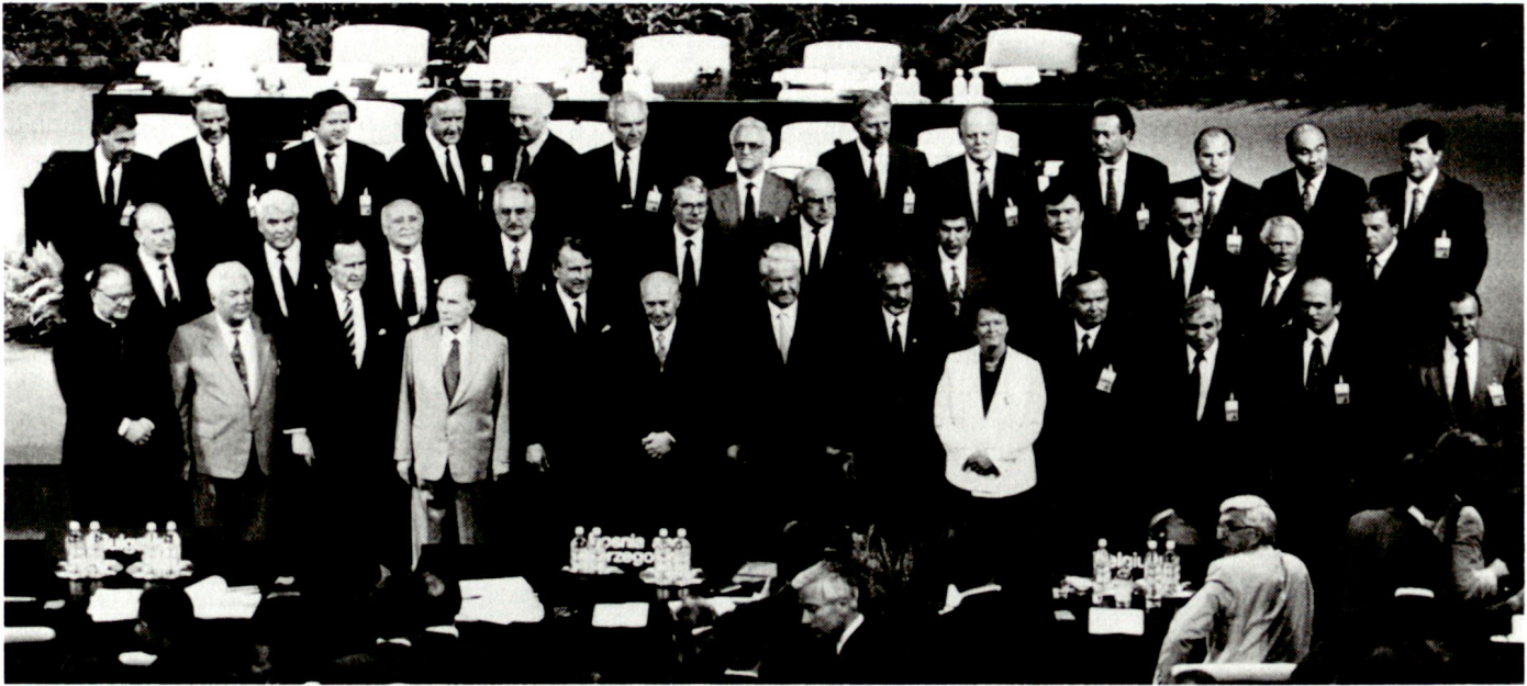
Gruppenbild der Spitzenvertreter der 51 Mitgliedstaaten am KSZE-Gipfeltreffen 1992 in Helsinki.

Im Rahmen dieser umfassenden Code of Conduct-Verhandlungen glauben wir unseren und den gesamt-europäischen Stabilitätsinteressen dadurch am besten dienen zu können, dass wir zur raschestmöglichen Herstellung gemeinsamer demokratischer, ökonomischer und sicherheitspolitischer Standards im gesamten KSZE-Raum beitragen und die Fähigkeit der KSZE zur kollektiven Solidarität stärken, ausgehend davon, dass die NATO das Kerngebilde eigentlicher militärischer Sicherheitsgarantie bleiben soll.