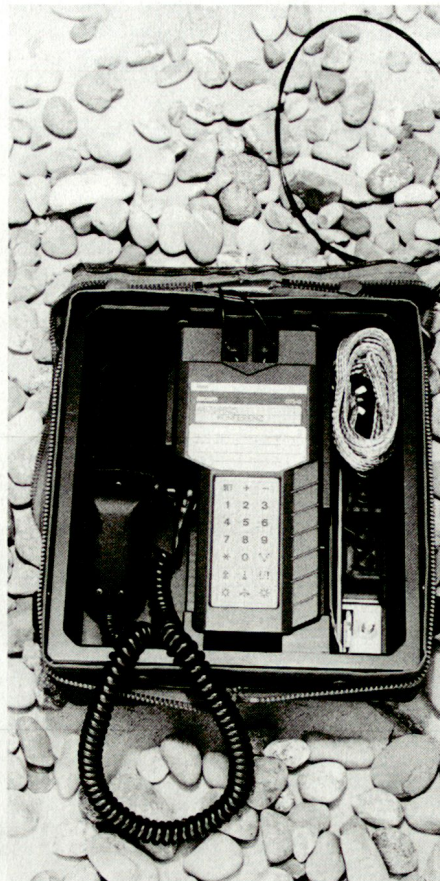
Wetterfeste, für den Einsatz im Freien konstruierte Telefonstation DTS-G.

nerseits für die Systemsoftware, andererseits für die Gestaltung und die Bedienung der Geräte. Für den Einsatz in Kommandoposten wird deshalb zurzeit eine Telefonstation entwickelt, die weitgehend bau- und bedienungsgleich ist wie ein moderner Büroapparat (DTS-K). Für den Einsatz im Freien hingegen wird eine robuste und wetterfeste Station benötigt (DTS-G, Bild). Beide Geräte verfügen über einen leistungsfähigen Display.