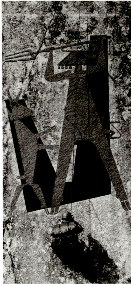
Gebirgsspezialist bei der Ausbildung an der Teufelswand in der Schöllenen

Da das bisher praktizierte System der Zweitausbildung wegen der verkürzten Dienst- und Ausbildungszeiten ausgedient hat, werden neu pro Jahr rund neunzig gewissenhafte Allround-Alpinisten als Gebirgsspezialisten ausgehoben und anschliessend in