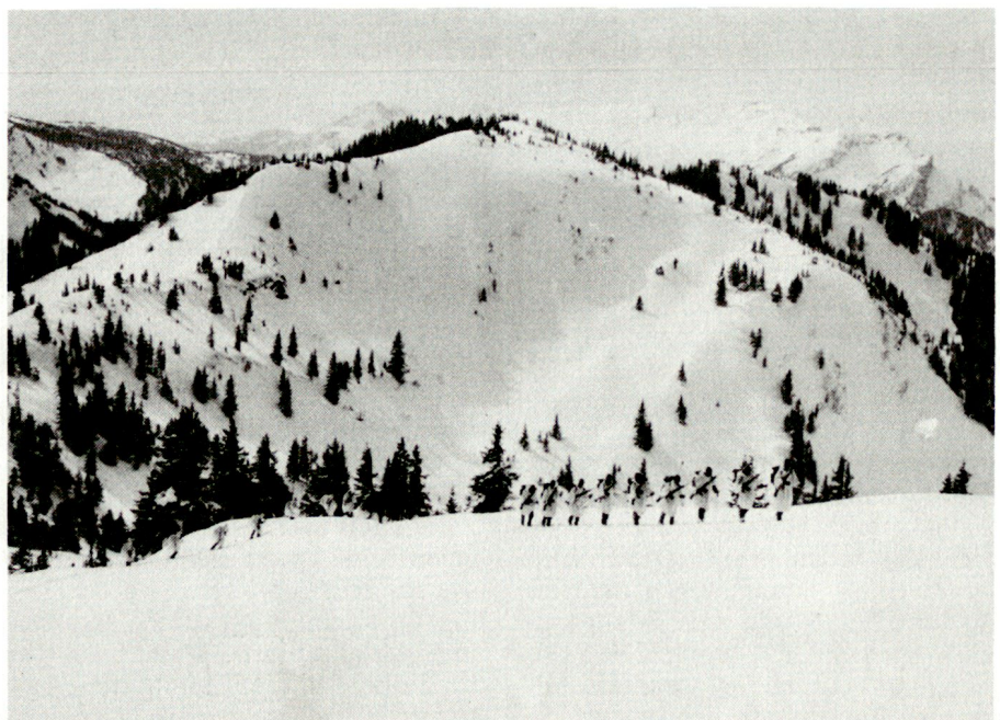
Gebirgstruppen im Einsatz

Trotz oder wegen der gewichtigen Neuerungen bleibt die Sicherheit weiterhin oberste Maxime in der Gebirgsausbildung.