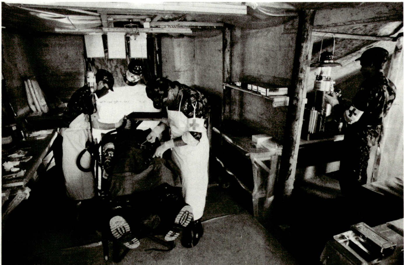
Behandlungsraum einer Sanitätshilfsstelle mit reduzierten Platzverhältnissen.

Summieren wir all diese Überlegungen, so stellt sich die Frage, wie viele Ärzte wir denn für die «Armee 95» tatsächlich brauchen. Ein kleineres Heer braucht sicher weniger Sanitätspersonal, also auch weniger Ärzte. Die Kampfverbände haben aber nach wie vor ihren Verteidigungsauftrag,