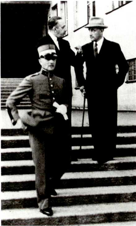
Oberst Ludwig Willmann , Kommandant des Gebirgsinfanterieregimentes 19, Architekt Armin Meili (Mitte) und Exilkönig Alfons XIII. von Spanien beim Besichtigen der Kaserne Luzern kurz vor dem Zweiten Weltkrieg.*