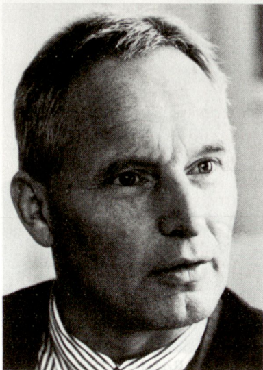
Dr. Ulrich Fässler, Regierungsrat, Vorsteher des Militärdepartements und des Polizei- und Umweltschutzdepartements, 6002 Luzern

Regierungsrat und Stadtrat von Luzern begrüsst diese Idee und boten unverzüglich Hand zur Bildung einer funktionstüchtigen Projektorganisation. Um einen sicheren Einstieg in die Projektarbeit zu gewährleisten, liess der Regierungsrat eine Machbarkeitsstudie erstellen.