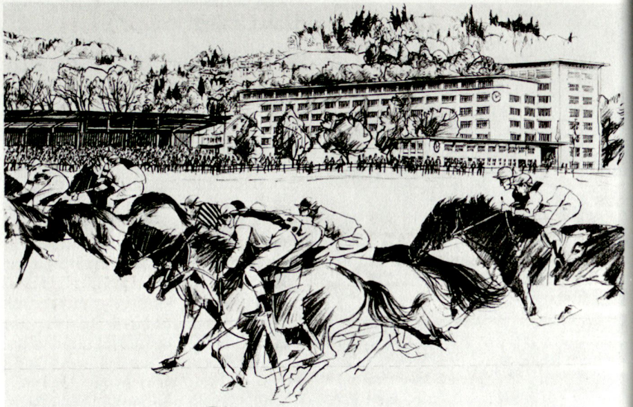
Wo Militär, Sport und Zirkus friedlich vereint sind: Die Luzerner Allmend.

Die gemeinsame Projektarbeit von Bund, Kanton und Stadt Luzern ist ausgezeichnet angelaufen. Die Luzerner Behörden sind bereit, alles dazu beizutragen, dass das Projekt im vorgesehenen Zeitrahmen realisiert werden kann.