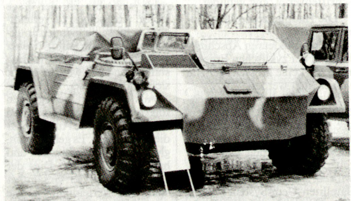
Vorstellung des neuen russischen Geländefahrzeuges GAZ-47 (4x4).

Mit den gestiegenen Anforderungen an die russischen Krisenreaktionskräfte, die zunehmend in den Krisenregionen Osteuropas zum Einsatz gelangen, ergeben sich aufgrund der gemachten Erfahrungen neue Ausrüstungsbedürfnisse. In diesem Zusammenhang ist ein zunehmender Trend zu leicht gepanzerten, äusserst mobilen Räderfahrzeugen festzustellen. Diese sind in bezug auf Nutzlast, Mobili-