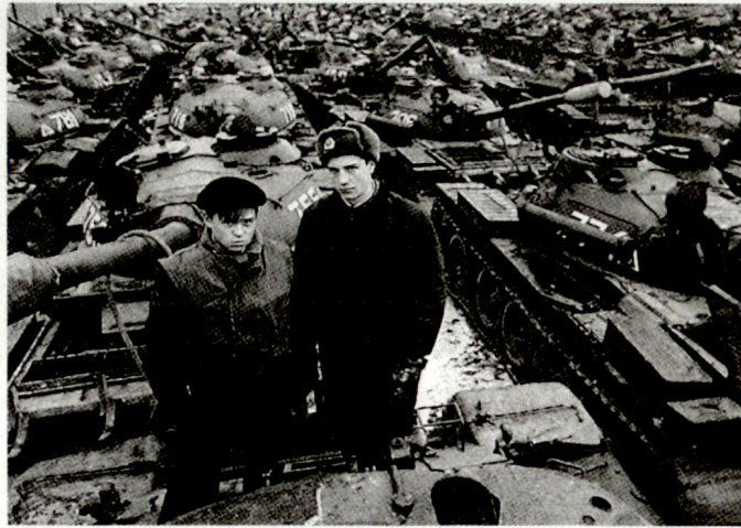
Russland hat zunehmend Schwierigkeiten bei der Zerstörung/Verschrottung überschüssiger Wehrtechnik.

Mangels vorhandener Einrichtungen für die Zerstörung oder Unbrauchbarmachung einer derart grossen Zahl von schweren Waffen mussten vorerst Kampffahrzeuge und teilweise auch Flugzeuge in improvisierten Lagern zusammengeführt werden. Dies führte nicht nur zu zusätzlichen Kosten, sondern vergrösserte auch das Risiko, dass Teile davon auf dem Waffen-Schwarzmarkt landeten. Mit den vereinbarten Inspektions- und Verifizierungsmassnahmen ist nämlich weder eine Kontrolle noch Sicherung solcher improvisierter Depots vorgesehen. Somit bilden diese Lagerorte seit einiger Zeit für militärische Kommandanten und Truppenverbände günstige Voraus-