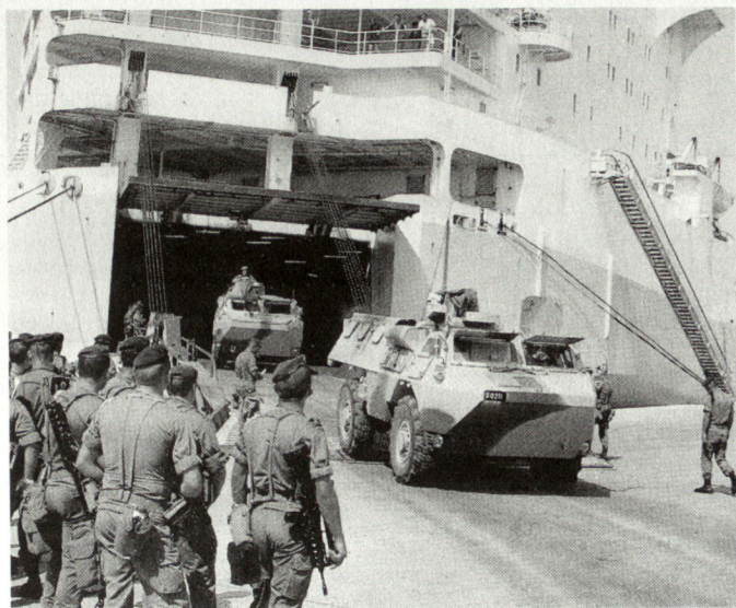
Für Operationen ausserhalb des NATO-Raumes werden neue Transport- und Führungsmittel benötigt.

eine Bedrohung nationaler Sicherheitsinteressen, die nicht direkte Bedrohung eines NATO-Landes bedeuten müssen. Für die Verteidigungsaufgabe haben wir uns an die Einstimmigkeit in der Allianz gewöhnt. Für die neuen Einsätze entscheiden jedoch die einzelnen NATO-Länder selbständig, ob und evtl. wie sie sich an einer Operation beteiligen wollen.