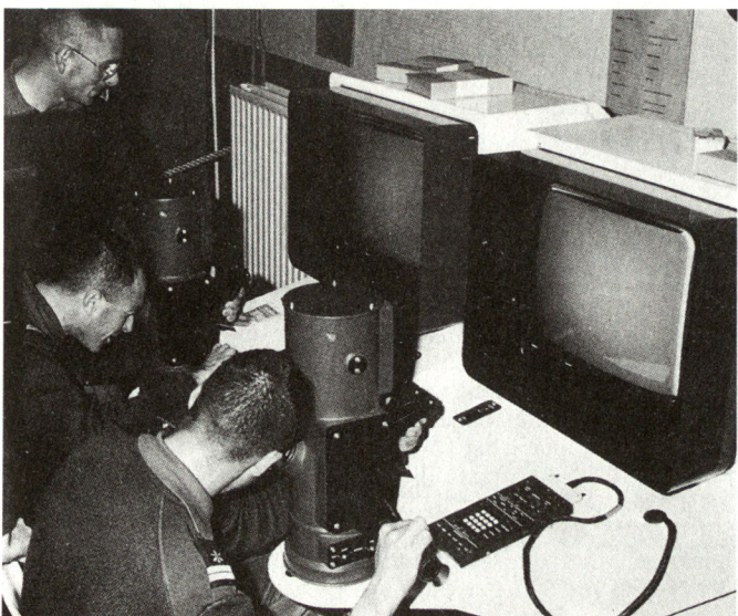
Simulatoren für die Ausbildung an Wärmebildgeräten.

Einsätze ausserhalb der NATO werden ausgelöst durch