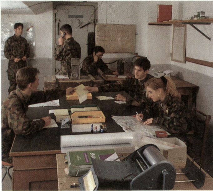
Frauen haben in der Armee grundsätzlich die gleichen Rechte und Pflichten wie die Männer und sind in den Truppengattungen bzw. Dienstzweigen, in welchen sie Dienst leisten, voll eingegliedert.