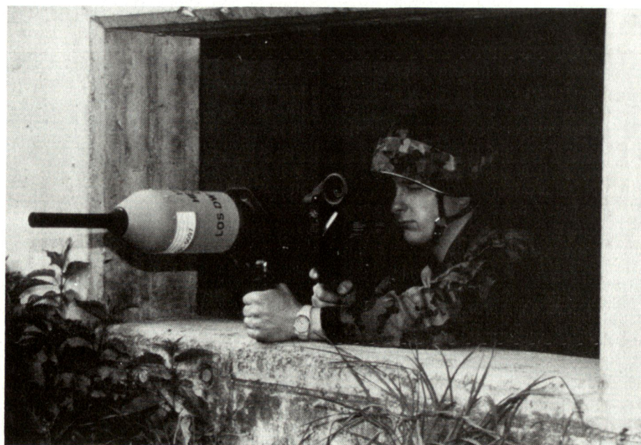
Die traditionelle Aufgabe der Armee bleibt: Durch Verteidigungsfähigkeit hat sie einen Beitrag zur Kriegsverhinderung zu leisten und, wenn nötig, Volk und Land einschliesslich den Luftraum zu verteidigen.

Der Dienst für militärische Sicherheit beurteilt die militärische Sicherheitslage, indem er Informationen auswertet und zu Lagebeurteilungen bzw. Gefährdungsprognosen verarbeitet. Nur in der ausserordentlichen Lage ist die aktive Nachrichtenbeschaffung mit Auftrag des Bundesrats zulässig.