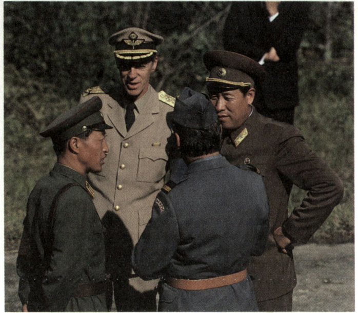
Der Friedensförderungsdienst wird neu im Militärgesetz aufgenommen. Gestützt auf Verordnungsrecht werden derartige Dienstleistungen seit 1953 praktiziert: Angehörige der «Neutralen Überwachungskommission für den Waffenstillstand in Korea» im Gespräch mit nordkoreanischen Offizieren.

Dem Dienst für militärische Sicherheit obliegt zudem der Schutz militärischer Informationen und Objekte. Für die präventive Sicherung der Armee vor Spionage und Sabotage und die Abwehr rechtswidriger Handlungen gegen die militärische Landesverteidigung ist in der ordentlichen Lage allein die Polizei im Rahmen ihrer Aufgaben im Staatsschutzbereich zuständig. Diese Tätigkeiten kann der Sicherheitsdienst der Militärpolizei wahrnehmen, wenn er zum Assistenz- oder Aktivdienst aufgeboden worden ist.