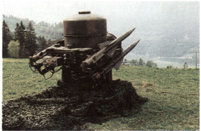
Abb. 2: Die «Rapie»-Feuereinheit wird mit Vorteil auf einer über dem zu schützenden Flugplatz gelegenen Anhöhe in Position gebracht. (Flab Br 33)

Fahrer) ausgebildet. Während der Rekrutenschule erfolgt die Verbandsausbildung auf den Stufen Feuereinheit und Batterie.