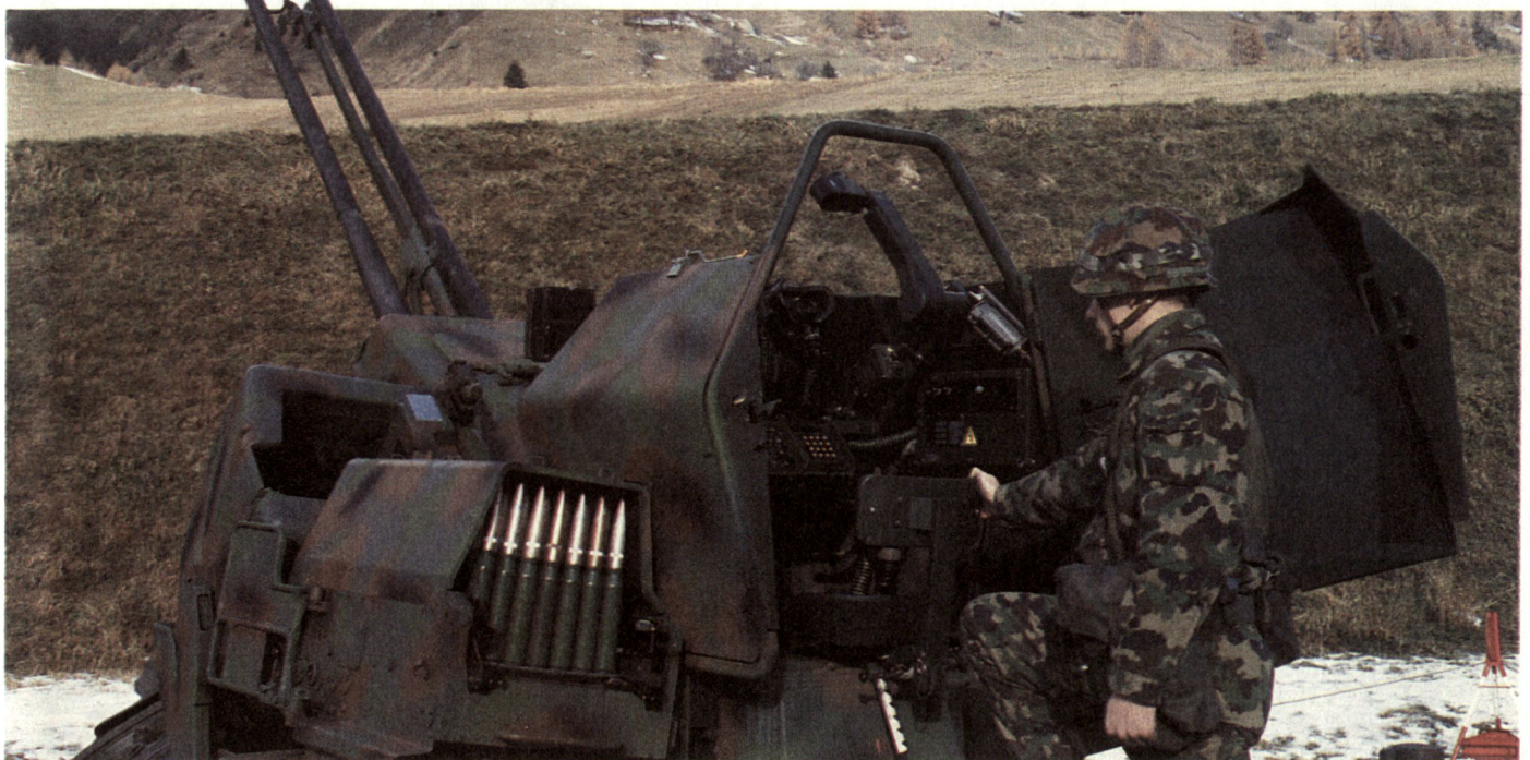
Abb. 3: 35-mm-Fliegerabwehrkanone 63/90.

Die Zielsetzung der «Fliegerabwehr-Feuer und Flieger-Bewegungs-Koordination» FEBEKO ist die effiziente Bekämpfung gegnerischer Luftfahrzeuge bei grösstmöglicher Bewegungsfreiheit