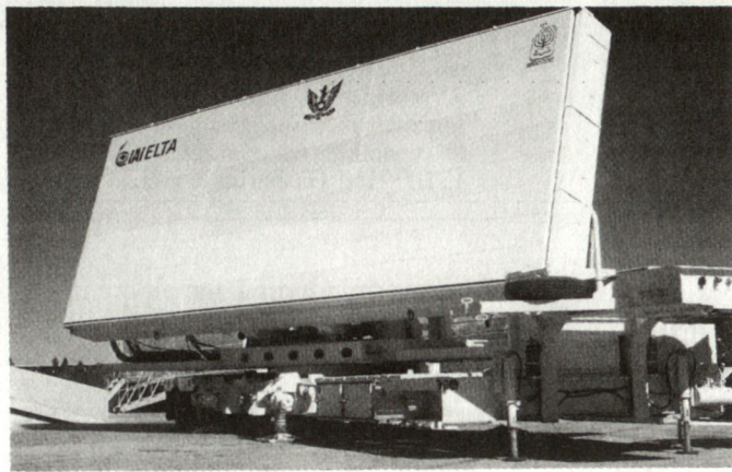
Abb. 2: Radargeräte sind das Kernstück jedes Raketenabwehrsystems. Im Bild der Feuerleitradar des «Arrow»-Systems.