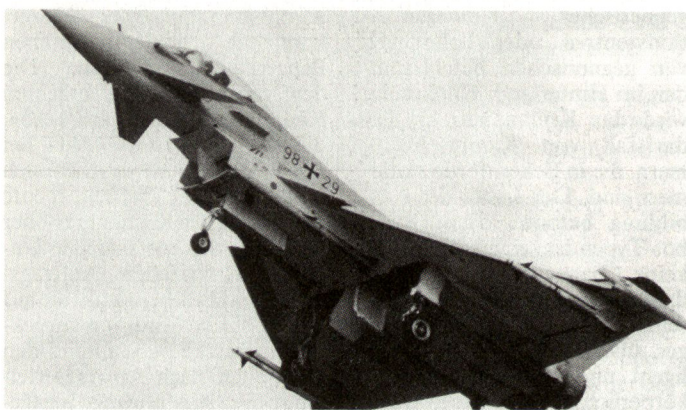
An der Beschaffung von 180 Jägern 2000 soll festgehalten werden.

Etliche wehrpolitisch tätige Verbände, an deren Spitze die österreichische Offiziersgesellschaft, forderten den Rücktritt des Innenministers. Die Realisierung seiner Vorschläge wür-