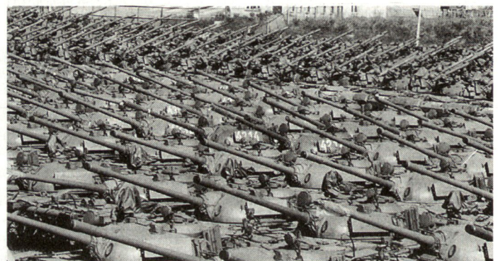
Kampfpanzer T-54/T-55 der ehemaligen NVA, die unterdessen alle zerstört worden sind.

Trotzdem wurde von den Vertragsstaaten bis zuletzt nach einer möglichst vertragskonformen Kompromisslösung gesucht, die insbesondere den Anliegen Russlands entgegenkommen und auch die wirtschaftlichen Probleme in Osteuropa mitberücksichtigen sollte. Das