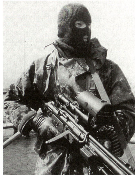
Die deutsche Bundeswehr verfügt seit 1. Januar 1996 über einen Spezialverband für Sonder-einsätze.

Für den 1. Januar 1996 hat der Bundesminister der Verteidigung die Aufstellung eines neuen Spezialverbandes für den Einsatz in Notsituationen als «Kommando Spezialkräfte» befohlen. Hierdurch wird die Bundeswehr über Kräfte verfügen, mit denen sie in der Lage sein wird, insbesondere bei Krisenreaktionseinsätzen in unmittelbare Not geratene Solda-