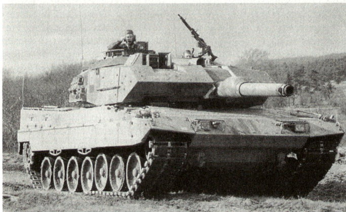
Kampfwertgesteigerter Kampfpanzer Leopard 2-A5.

Im Rahmen der «Partnerschaft für den Frieden» üben seit einiger Zeit NATO-Verbände oder -Einheiten gemeinsam mit solchen aus ehemaligen WAPA-Staaten. Das ist inzwischen fast Routine geworden. Vor allem in Grenznähe, zum Beispiel an der Grenze zwischen Deutschland und Polen, entstanden Patenschaftsverhältnisse zwischen vergleichbaren deutschen und polnischen Verbänden. Mitte Dezember übten auf dem polnischen Truppenübungsplatz bei Sagan eine Kompanie der 15. Panzergrenadierdivision aus Doberlug-Kirchhain mit einer Panzerkompanie der 11. polnischen Panzerkavalleriedivision. Die deutschen Verbände brachten Kampfpanzer «Leopard 1-A5», die Polen T-72 zum Einsatz. Bei der Trefferaufnahme stellte sich heraus, dass die Trefferausbeute der polnischen Kompanie höher lag. Hier machte sich der Unterschied zwischen Auftrags-taktik und Befehlstaktik, die auf alte russische Tradition zurückgeht, bemerkbar. Während den Deutschen nach Auftragserteilung die Ausführung weitgehend frei überlassen blieb, hat-