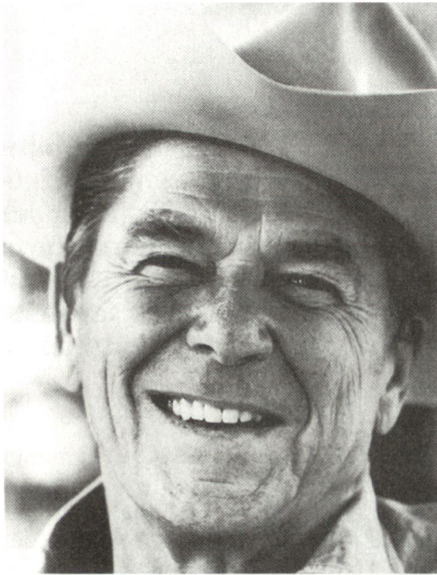
Ronald Reagan, 40. Präsident der USA von 1981 bis 1988, kümmerte sich nicht um Details. Er legte die allgemeinen Interessen und Ziele fest.