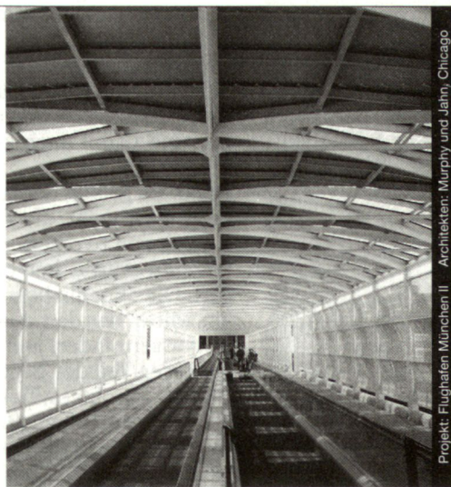
Projekt: Flughafen München II - Architekten: Murphy und Jain, Chicago

Stahl-Glas-Konstruktionen in architektonisch perfekter Vollendung verwirklichen wir mit innovativen Ideen und höchsten Anforderungen an Materialien und Ausführung.