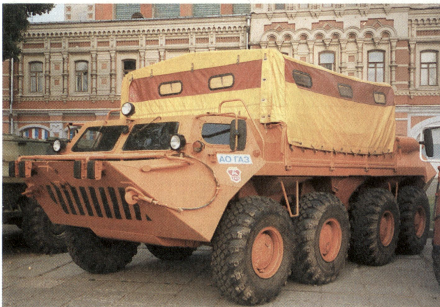
Dass einem solchen «zivilen» Transportfahrzeug auf Basis des Radschützenpanzers BTR-80 wenig Erfolg beschieden ist, erstaunt nicht.

Dagegen nahm die Hoffnung zu, bei Rüstungsexporten mehr zu verdienen. Zusammen mit der psychologisch völlig anders ausgerichteten Einstellung der in der Rüstungsindustrie Beschäftigten hat diese Perzeption die ursprünglich durchaus vorhandene Neigung zur Konversion immer mehr in den Hintergrund treten lassen. Die Konversion wurde in eine «ökonomische Konversion» umgetauft, die darauf zielt, nur solche Veränderungen im Bereich der Rüstungsindustrie vorzu-