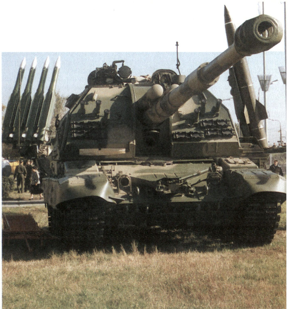
Russland will mit allen Mitteln die Waffenexporte fördern. Die Panzerhaubitze 2S19 152 mm gehört zum angebotenen Sortiment.

Die Konversion zur zivilen Produktion erwies sich für die Betriebe der rus-