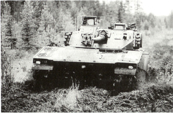
Kampfschützenpanzer CV-9030 N für die norwegische Armee.

Wärmebildgerät für den Richtschützen installiert. Angetrieben wird der Schützenpanzer durch einen Dieselmotor V8 mit 605 PS Leistung. Der CV-