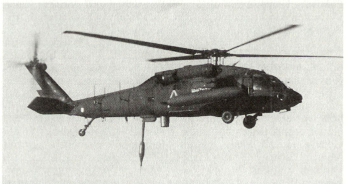
Helikopter EH-60 Blackhawk, der mit speziellen Elektronikgeräten ausgestattet ist.

von der Reaktivpanzerung waren einerseits die positiven Entwicklungsanstrengungen im Bereich der passiven Zusatzpanzerungen und andererseits auch die beschleunigte Einführung von Tandem-Hohlladungen zum Einsatz gegen Reaktivpanzerziele. Unterdessen sind aber die Entwicklungen sowohl im Munitions- wie Schutzbereich weiter fortgeschritten, so dass sich bezüglich der künftigen Kampfwertsteigerungen gewisse Unsicherheiten abzeichnen. In den USA wird aus diesem Grunde die Bradley-Mo-