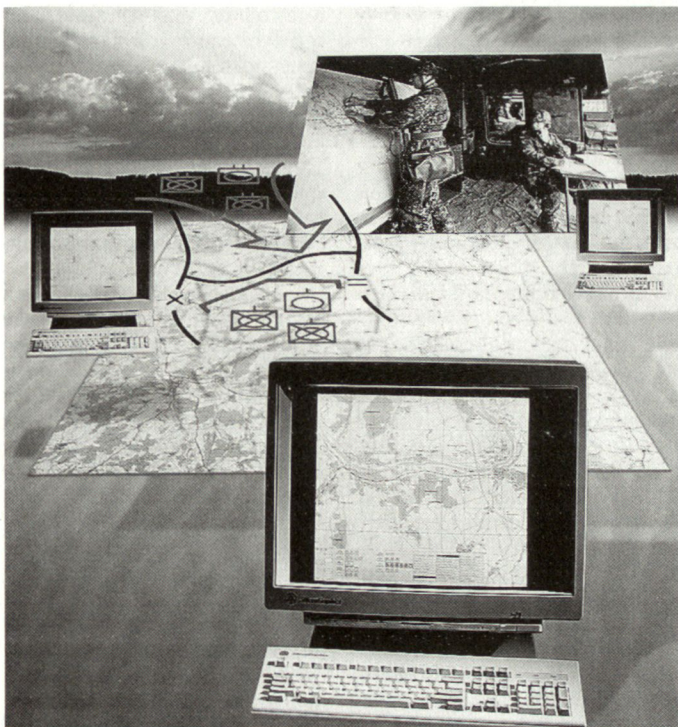
Gefechtssimulationssysteme für die Offiziersausbildung im österreichischen Bundesheer.

Theresianischen Militärakademie eingerichtet werden. Diesen österreichischen Ausbildungsstätten obliegt die allgemeine Kommandeurs- und Stabsausbildung. Die von CAE entwickelten, computergestützten interaktiven Gefechtssimulationssysteme werden für die taktische Aus- und Weiterbildung auf Bataillons- und Brigadeebene eingesetzt. Mit den neuen