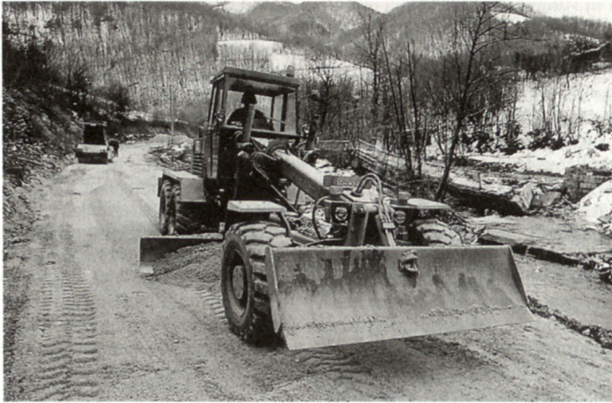
Auch die französischen Truppen in Bosnien benötigten genietechnische Unterstützung.

beiden Seiten der ehemaligen Frontlinie).