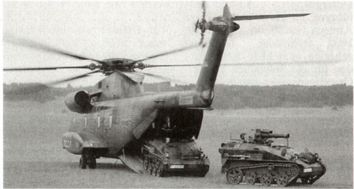
Luftmechanisierte Truppen bilden das Rückgrat der deutschen Krisenreaktionskräfte (KRK).

Diese wirkt sich auf die Struktur und Organisation der Grossverbände, aber auch auf die Ausgestaltung der Wehrpflicht aus. Die Mindestdienstzeit beträgt zehn Monate mit einer besonderen Verfügungsbereitschaft von zwei Monaten. Um die gleichen Ausbildungsziele wie früher erreichen zu können, wird auf den bisherigen Dienstzeitausgleich durch Frei-