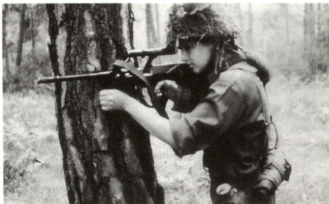
Frauen in Uniform – bald auch beim österreichischen Bundesheer?

Am 26. Februar 1996 trat nach einem Austausch von Noten zwischen NATO-Generalsekretär Solana und dem österreichischen Vizekanzler Schüssel das individuelle Partnerschaftsprogramm der Republik Österreich für die nächsten Jahre in Kraft. Bereits am 10. Februar des Vorjahres hatte Österreich die Annahmeerklärung der an alle OSZE-Staaten ergangenen Einladung zur Teilnahme an der NATO-Partnerschaft für den Frieden unterzeichnet. Österreich plant unter anderem die Entsendung von Stabsoffizieren zu fünf Übungen in multinational zusammengesetzte Stäbe sowie den Einsatz eines verkleinerten Bataillonsgeschwaders als Übungsleitungsgruppe im Zuge mindestens einer weiteren Übung. Dazu kommt die Teilnahme einer Fliegerabwehrgruppe an einer PfP-Fliegerübung und die aktive Be-