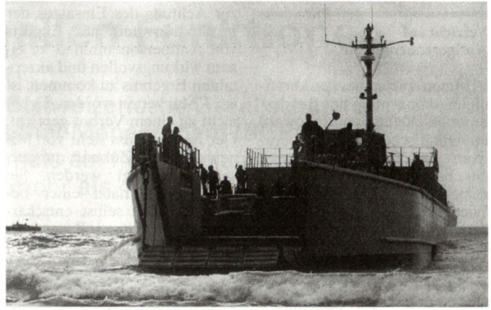
Landungsboot der französischen Marine-Infanterie.

Um auf Abruf bereit zu sein, wird der Nachrichtendienst forciert, um potentielle Einsatzre-