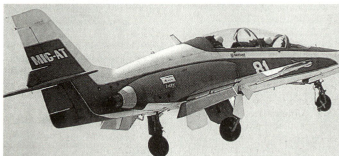
Russischer Kampfftrainer MiG-AT anlässlich einer Flugvorführung.

Israel soll zudem künftig von den USA noch vermehrt mit detaillierten Informationen aus der Satellitenaufklärung, insbesondere mit Daten über allfällige Raketenangriffe, beliefert werden. Ein erfolgreicher Einsatz von Abwehrwaffen gegen Raketenbeschuss lässt sich schlussendlich nur nach entsprechender Vorwarnung und dem zeitgerechten Vorliegen von aktuellen Informationen über deren Flugbahnen gewährleisten. hg