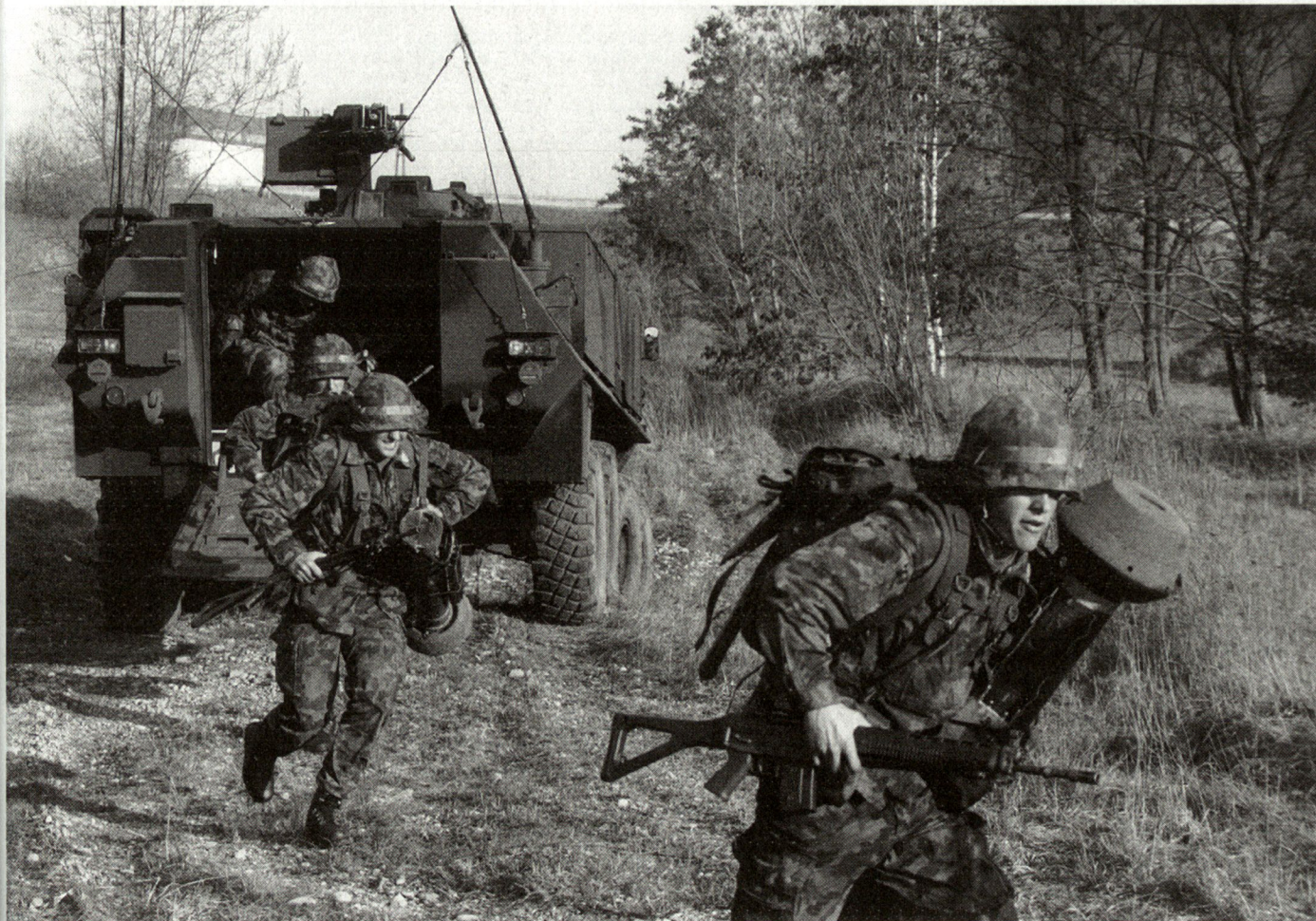
Bedenken über inskünftig fehlende Identifikation mit der Waffengattung Infanterie sind völlig unbegründet: Die Waffengattung Infanterie bleibt bestehen. Abb.: Infanteristen verlassen den Radschützenpanzer.

Um sich dieser Kernfunktion in der Ausbildung voll widmen zu können, wurden die bisherigen Aufgaben eines Bundesamtes bzw. Waffenchefs auf die Stufe des Inspektors bzw. Direktors BAKT zusammengefasst und vorwiegend der Abteilung «Koordination und Steuerung» überwiesen. Hier übernehmen die drei Sektionen «Ausbildungssteuerung», «Einsatzverfahren und Grundlagen» sowie «Ausrüstung und Vollzug» diese planerischen und doktrinären Aufgaben und entlasten bzw. unterstützen die Ausbildungsstätten