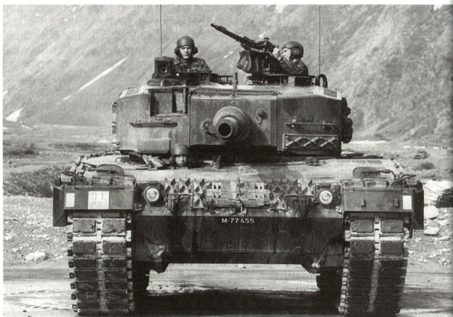
Die Angehörigen der Mechanisierten und Leichten Truppen haben weiterhin allen Grund, auf «ihre» Waffengattung stolz zu sein. Abb. Ausbildung am Kampfpanzer Leopard 2.

Im Jahr 1996 geht es darum, diese neuen Strukturen und Führungsabläufe einzuspielen, Schnittstellen zu erkennen und die Verantwortungen und Kompetenzen endgültig zu regeln. Eine Herausforderung an alle Chefs und Mitarbeiterinnen, die als Mitspieler und nicht als Zuschauer diese Aufgabe wahrnehmen.