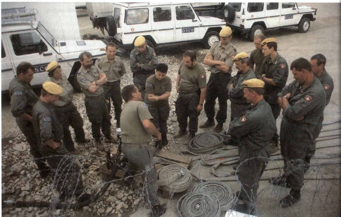
Die logistische Unterstützung der OSZE durch die Schweizer Gelbmützen wird von allen Beteiligten sehr geschätzt. Ausbildung der Angehörigen der «Swiss Headquarters Support Unit».

Die Frage wurde 1990 verneint. Die neue, auf Demokratie und Marktwirtschaft beruhende Ordnung war aber noch zu fragil, als dass man bewährte Werkzeuge der Zusammenarbeit hätte weglegen können. Integration nach westlichem Muster konnte nur längerfristig ins Auge gefasst werden.