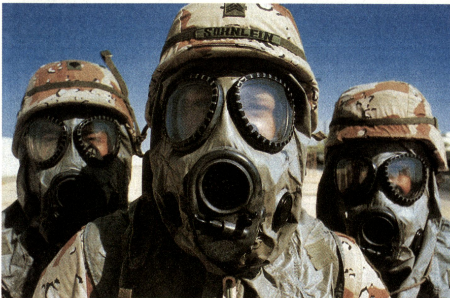
Die gegen den Irak eingesetzten alliierten Truppen mussten sich gegen verschiedenste Nervengifte schützen.

Es gibt keine Massenerkrankungen , die auf den aktiven Einsatz solcher Stoffe als Kampfmittel oder deren passive Freisetzung als Folge von Bombardierungen schliessen lassen. Weder bei der örtlichen Zivilbevölkerung noch bei den Veteranen sind zu diesen Krankheitsereignissen passende Krankheitsbilder aufgetreten.