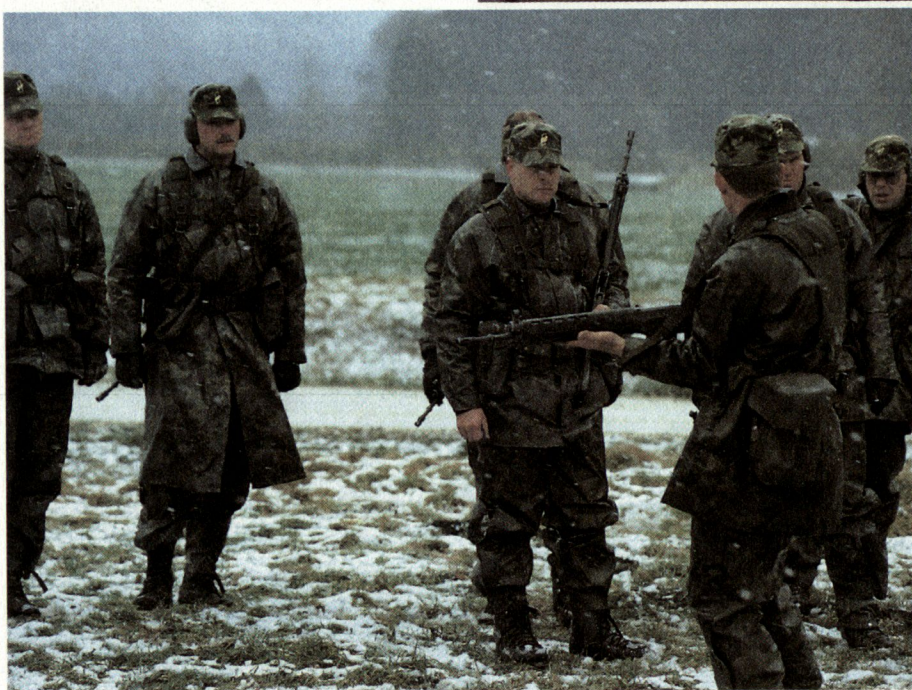
Als Soldat bemüht sich der Instruktor täglich, ein Vorbild zu sein für die übrigen Angehörigen der Armee: Abb. Schiessausbildung beim Infanterie-Ausbildungszentrum Walenstadt.