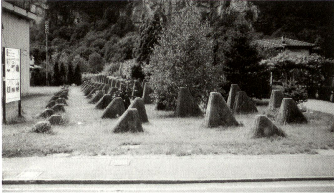
Gelände-Panzerhindernis in Lodrino.