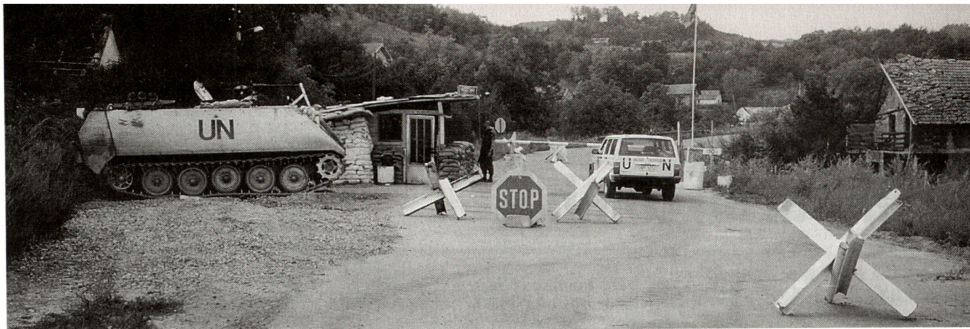
Point de contrôle canadien dans le secteur Ouest de la Croatie en mars 1993.

■ situation calme (faible intensité des combats): une rotation était organisée au sein des points d'appui: