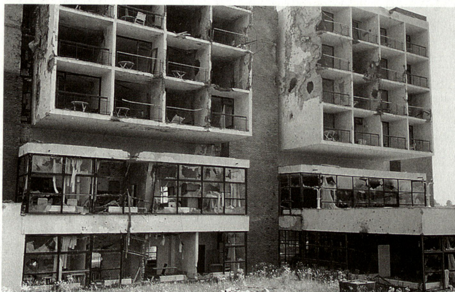
Les ruines de l'hôtel «Thermal» à Gradacac au nord de la Bosnie en 1993. (William Gargiullo)