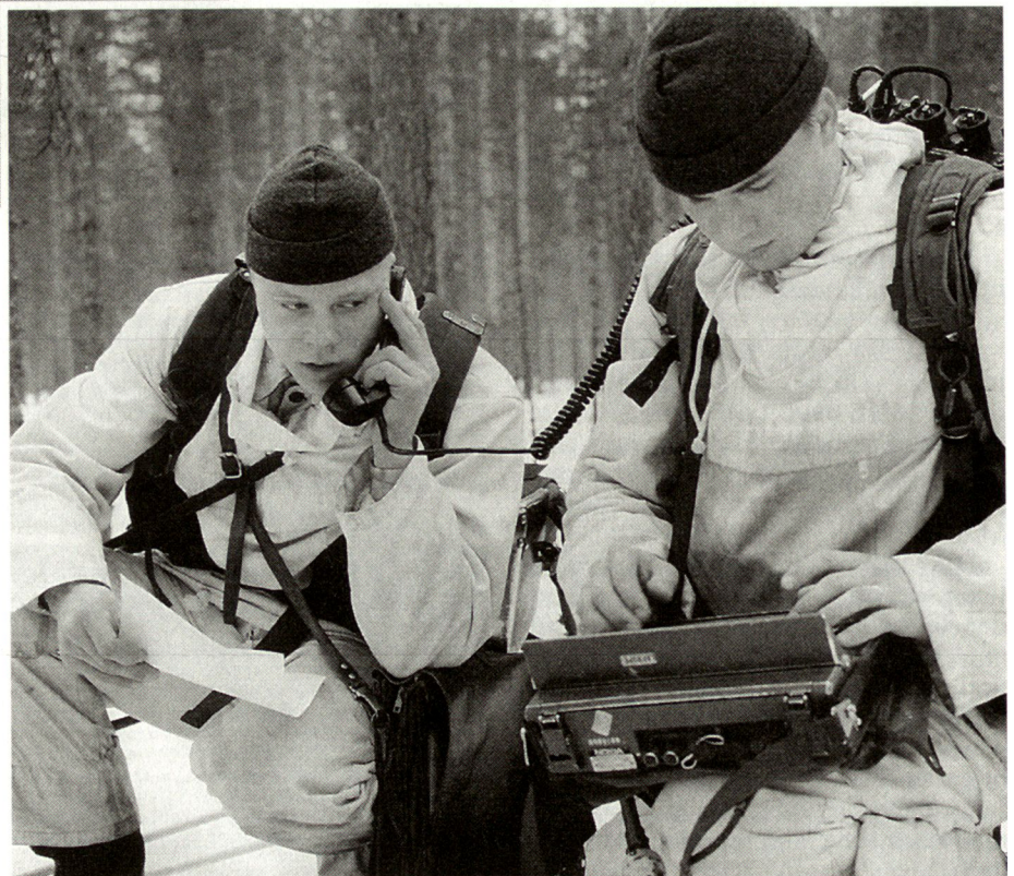
Die Durchführung militärischer Ausbildung ist in Friedenszeiten die sichtbarste Aufgabe der Verteidigungskräfte. Oberstes Ziel: Kampffähige Truppen.

Die Albanien-Operation geht noch einen Schritt weiter, dient nicht nur