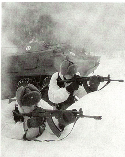
Alle Soldaten werden unter harten Winterbedingungen ausgebildet.

PfP-Aktivitäten ermöglichen Finnland ferner, mit NATO-Verfahren, Signaturen, Kommandoverfahren usw. vertraut zu werden. Dies vereinfacht die internationale Friedensförderungs-kooperation und verschafft viel techni-