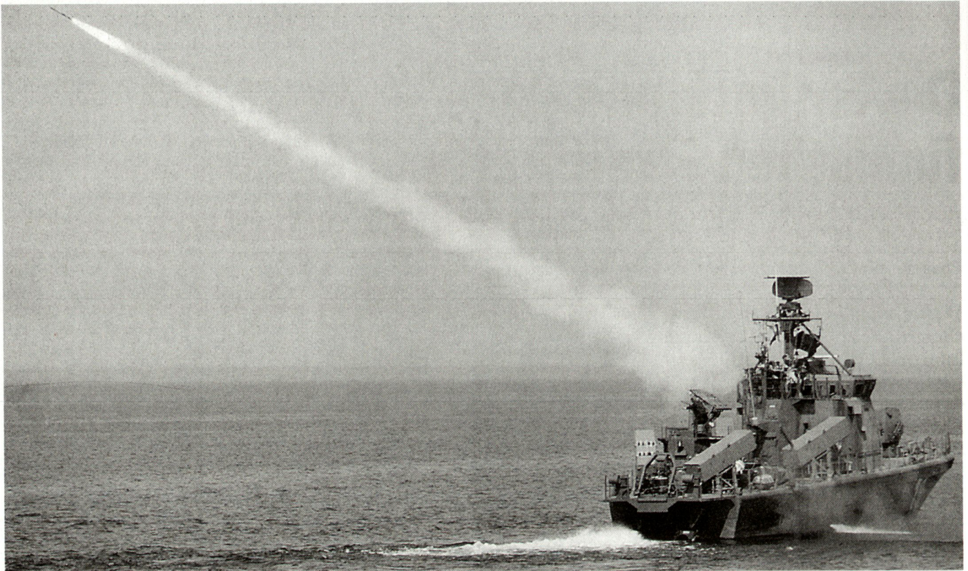
Feuerstarke Schnellboote sind ein wichtiger Teil der finnischen Seeverteidigung.

deranteil beträgt lediglich vier Prozent. Die Stärke der finnischen Verteidigungskräfte beträgt im Kriegsfall ungefähr 500 000 Mann. Die Stärke des Heeres beträgt hierbei ungefähr 420 000 Mann, der Luftstreitkräfte ungefähr 35 000, der Marine 8000 und des Grenzschutzwesens 23 000 Mann. Der Anteil der Frauen liegt seit 1994 bei einem Bestand von lediglich rund 500. Die neue Streitkräftestruktur berücksichtigt die demografische Entwicklung insofern, als die Kriegsstärke in Zukunft auf 430 000 Mann sinken soll.