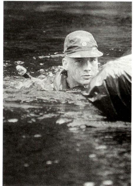
Die kargen Naturverhältnisse Finnlands sind ein Vorteil für den Verteidiger.

sches Know-how. Das PfP-Programm befindet sich zwar erst im Aufbau, in Zukunft sind noch grössere Vorteile für die Teilnehmer zu erwarten, u.a. bessere gegenseitige Kenntnisse und grössere Prestige.