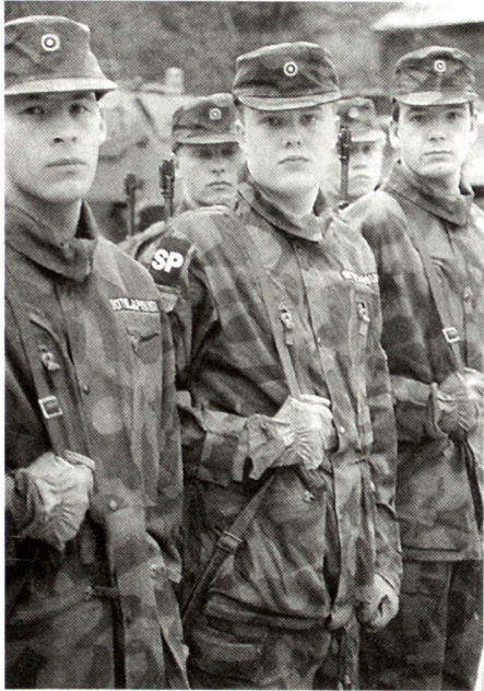
Finnland bildet jährlich ungefähr 24000 Grundwehrdienstleistende aus.

Welches sind die Beschaffungsschwergewichte der finnischen Streitkräfte?