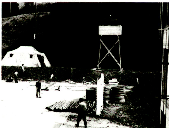
Gefangenen- und Interniertenlager sind auch im Jahre 2000 keine romantische Angelegenheit...