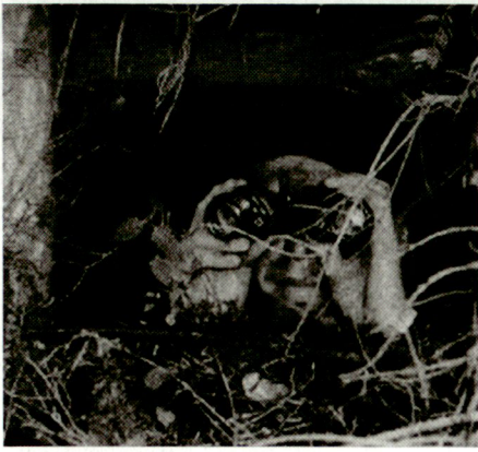
Aufklärer im Beobachtungsposten.

wie der Kdo / Uem Zfhr im Kommandobereich eingesetzt werden können.