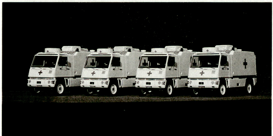
Dank modularem Aufbau kann der Duro flexibel genutzt werden.

Im Sortiment der bereits entwickelten Module findet sich weiter der Aufbau für Werkstattfahrzeuge. Andere Modelle sind für die Verwendung durch Feuerunterstützungsoffiziere der Artillerie oder als Peilfahrzeuge vorgesehen. Eine interessante Option bietet der verstärkte Aufbau für einen Einsatz bei der Militär- oder Bereitschaftspolizei.