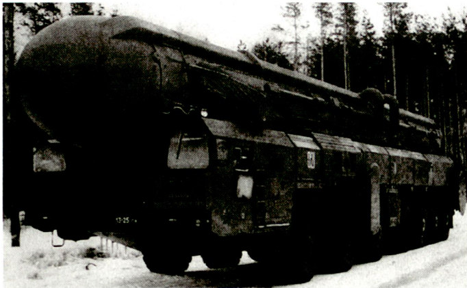
Mobiles strategisches Lenkwaffensystem TOPOL (SS-25).

wie z.B. in Kasachstan (Bai-konur) und an Raketenfrühwarnposten in anderen früheren Sowjetrepubliken. Besorgniserregend sei die Qualität der jungen Soldaten, an die gerade in den strategischen Raketenruppen besonders hohe Anforderungen gestellt werden müssen. Im letzten Auffüllkontingent waren 5% drogenabhängig, 8% – zwangsweise – Vorführung (Polizei), 24% stammten aus «ungünstigen» Familien, 52% hatten keine Mittelschulbildung.