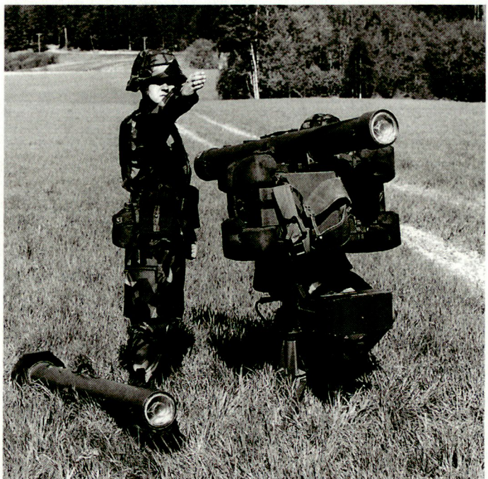
Eine Berufsarmee kommt für Schweden nicht in Frage. Bild: Flab-Lenkwassensystem RBS-70.

Tatsache ist, dass für Schweden in nächster Zeit eine Berufsarmee (politisch und finanziell) nicht in Frage kommt. Andererseits ist auch eine – politisch immer noch gültige – Umsetzung der allgemeinen Wehrpflicht aus finanziellen Gründen (Sparmassnahmen) kaum mehr machbar. Die derzeitige politische Maxime, dass alle Wehrpflichtigen einberufen und zumindest einer Kurzausbildung zugeführt werden sollen, findet zwar bei den Streitkräften Zustimmung, ist jedoch in der Umsetzung zu teuer. Demzufolge wäre eine selektive Einberufung, die auf die künftigen Bedürfnisse verringerter Mobstärken abgestimmt wird, eine logische Folge der jetzigen Situation. Untersucht wird in diesem Zusammenhang auch das dänische Modell, das vor allem die Freiwilligkeit bei der Einberufung zum Militärdienst fördert. hg