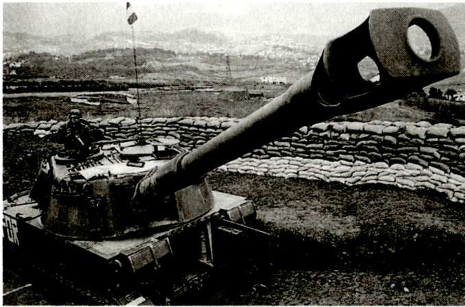
Panzerhaubitze M-109 bei den italienischen SFOR-Truppen.

km sowie auch die Minenraketen mit Panzerminen AT-2 als Submunition zur Verfügung. Im Zusammenhang mit der Ausweitung der terrestrischen Feuerwirkung wird heute in vielen MLRS-Nutzerarmeen eine mög-