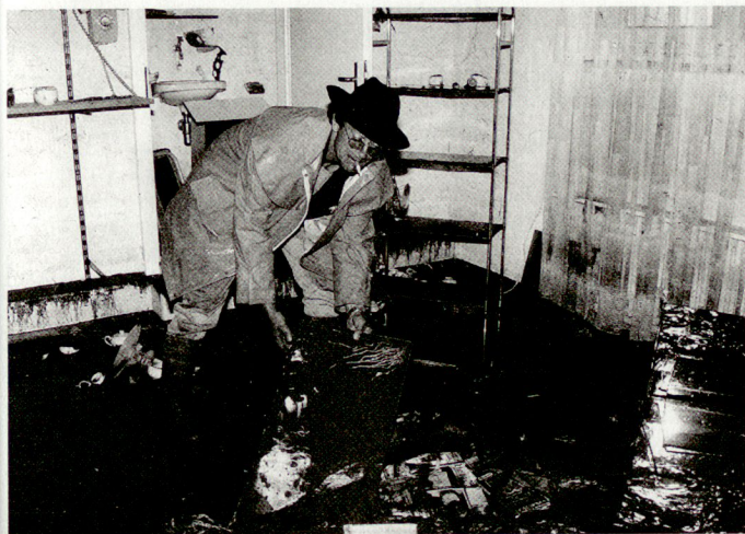
Hochwasserschaden im Wohnzimmer eines Wohnblocks an der Lettenmattstrasse in Birmensdorf ...

Diese Katastrophenplanung hatte noch einen weiteren gravierenden Mangel. Alle sorgfältig und nach