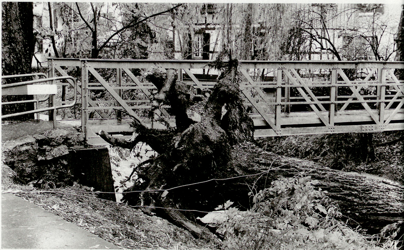
Gravierende Schäden waren auch entlang der Reppisch, hier in Dietikon, zu verzeichnen.