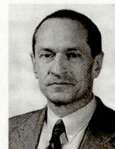
Oberst Peter Grütter ist Kommandant der Zürcher Kantonspolizei.

«Die Aktivitäten der Polizei zur Kriminalitätsbekämpfung und für die Aufrechterhaltung von Recht und Ordnung sind von erhöhter Bedeutung und sollen – unter Zuteilung der notwendigen Mittel, wobei auch Umverteilungen geprüft werden müssen – auf allen Stufen verstärkt werden.»