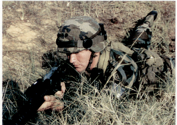
Die Sensoren werden am Helm und am Körper befestigt.

am Lasereinheit Display), akustisch (Kopfhörer), oder per Vibrationsmelder mitgeteilt.