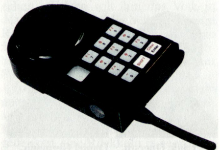
Die Master Box ist der Computer des Soldaten.

Um die Freund-Feind-Erkennung zu machen, betätigt der Soldat mittels eines Triggers den Laser, der einen kodierten IR-Strahl sendet. Trifft dieser erweiterte Laserstrahl einen Sensor eines anderen Soldaten, wird durch die Zentraleinheit des «Getroffenen» ein kurzes RF-Signal mit dem CID-Code übermittelt. Diese Bestätigung wird vom sendenden Soldaten empfangen, und falls es sich um einen Freund handelt, entweder visuell (rotes Licht