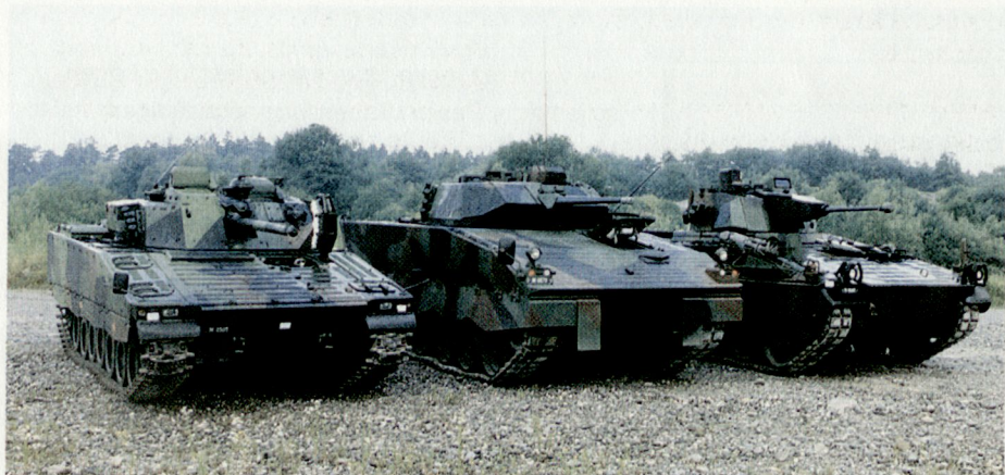
Die drei in der «Schlussrunde» verbleibenden Schützenpanzer: CV 9030 (links), Warrior 2000 (Mitte), KUKA M 12 (rechts).