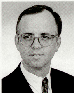
Werner Fasslabend, Dr., Bundesminister für Landesverteidigung, Wien.

Im Jahr 1997 erfolgte ein «Jahrhundertereignis». 1997 kam es zum NATO-Russland-Vertrag und zur Erweiterungsentscheidung der NATO und damit zum ersten Schritt der effektiven