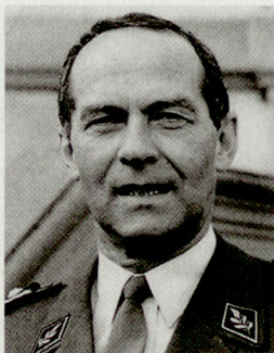
Jean Abt, Commandant du corps d'armée de campagne 1.

Tout change, rapidement. En maints domaines, des progrès fulgurants ouvrent des perspectives à priori positives. Dans le même temps cependant, des crises surgissent, des foyers s'enflamment et sous diverses formes, la guerre sème malheur et terreur. Dans leur manifestation implacable, haute technologie ou moyens primitifs conduisent aux mêmes résultats graves, catastrophiques et durables: la soumission, la désolation des communautés et des Etats mal protégés. On risque d'oublier l'histoire et ses enseignements. D'oublier le fait que les rapports entre les Etats sont le plus souvent des rapports de force. D'oublier les intérêts, les calculs des puissances, les changements stratégiques, les conséquences lointaines de phénomènes isolés, de décisions hâtives ou d'absence de décision.