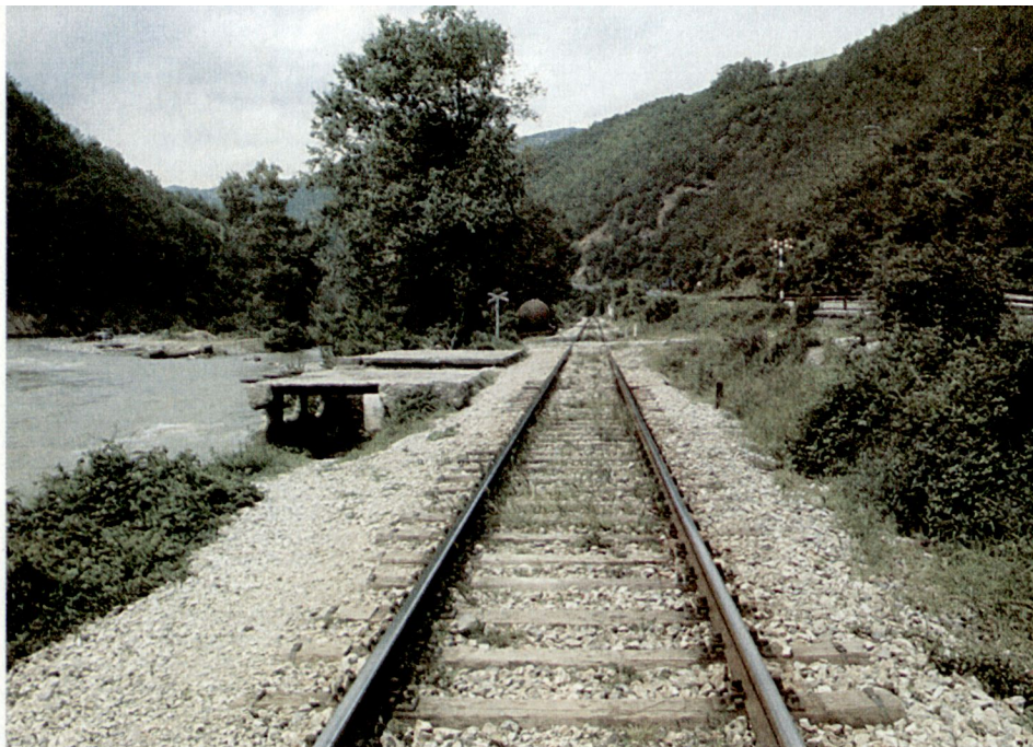
Eisenbahnlinie Kosova-Skopje (Weg der Vertriebenen).

Mittlerweile ist die NATO bekanntlich in den dritten Monat ihrer Luftangriffe eingetreten. Die Hoffnung, der serbische Führer werde nach der ersten Bombardierungswelle einlenken, stellte sich als Fehlkalkulation heraus. Angesichts massiver Verbrechen der serbischen Truppen an der albanischen Zivilbevölkerung und immer häufiger werdender Berichte über Vergewaltigungen von Frauen und Mädchen, von Erschiessungen und anderen Formen physischer und psychischer Gewalt ist klar, dass Kosova nicht mehr unter serbischer Jurisdiktion verbleiben kann. Rambouillet ist jetzt Makulatur geworden. Zur Lösung der Kosova-Frage braucht es neue Ideen, die den Willen der albanischen Bevölkerung Kosovos zu demokratischer Selbstverwaltung ausserhalb serbischer diktatorischer Bevormundung respektieren. Eine Aufteilung des Territoriums Kosovos kommt für die Albaner dabei nicht in Betracht, da die Serben die Bergwerke und das fruchtbare Land bekämen, also die gesamte Existenzgrundlage Kosovos. Die Albaner erwarten von den westlichen Staaten Kompromisslosigkeit in dieser Frage. Im übrigen würde die Teilung Kosovos einen Kniefall vor der Politik der «ethnischen Säuberung» Miloševics bedeuten. Das