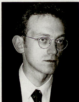
Enver Robelli, Korrespondent, Postfach 22, 8806 Bäch SZ.

In der Ortschaft Fushë-Kosovë (zu Deutsch: Amsfeld) hatte Milošević den Serben 1987 feierlich versprochen: «Euch darf niemand schlagen.» Bei einer anderen Gelegenheit hatte er gesagt: «Serbien wird entweder gross sein oder es wird überhaupt nicht sein.» Nachdem er mit Massen-«Meetings» den Boden bereitet hatte, entzog er Kosova durch einen Militär- und Polizeiputsch 1989 die Autonomie. Die Albaner wurden aus dem öffentlichen Dienst verjagt, aus der Polizei, den Fabriken, Schulen und Universitäten.