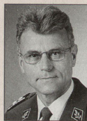
Paul Zollinger, Divisionär, Unterstabschef Lehrpersonal, Bern.

Die Armee XXI steht und fällt mit motiviertem und kompetentem Miliz- und Berufskader in genügender Zahl. Ich setze alles daran, damit wir gute Voraussetzungen für die Gewinnung der zusätzlich benötigten Berufskader schaffen können. ■