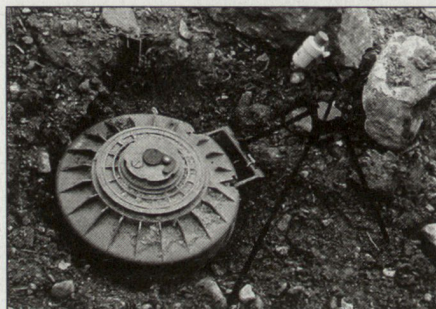
Panzerabwehrmine TMRP6 mit SM-EOD20-System.

Bosnien und für die KFOR im Kosovo ausgeliefert worden. Belgien, Finnland, Österreich und Luxemburg haben auch SM-EOD-Produkte eingesetzt. In anderen EU-Ländern stehen Evaluationen vor dem Abschluss. Auch die Schweizer Armee hat den Nutzen der Produktpalette für die humanitäre Minenbeseitigung erkannt und entsprechende Beschaffungen vorgenommen. Insgesamt stehen vier SM-Produkte zur Minenbeseitigung zur Auswahl. Neben der SM-EOD20 zur Vernichtung von Personenminen und Blindgängern produziert die SM die SM-EOD33 zur Vernichtung von vergrabenen und unter Wasser eingesetzten Minen und Blindgängern, die SM-EOD67 zur Vernichtung von Minen mit elektronischen Sperren und die SM-EOD190 zur Zerstörung von Bomben, die in einer Tiefe bis zu 4,5 Metern vergraben sind. (dk)