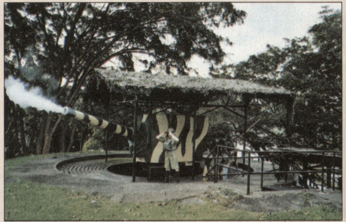
Küstengeschütz Zweiter Weltkrieg.