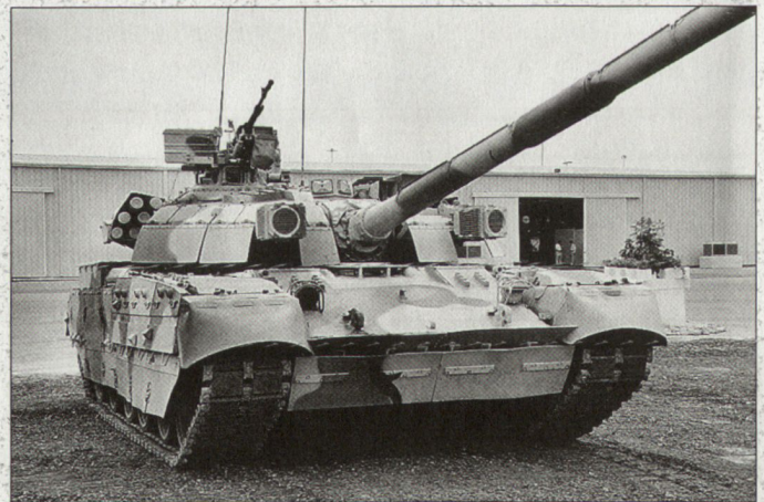
Der ukrainische Bewerber T-84U.

Vor kurzem wurde die traditionelle italienische Firma Alenia/Otobreda mit ihrem Typen «Ariete» von der Endevaluation ausgeschlossen.