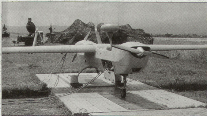
Einsatz des taktischen Aufklärungskörpers «Hunter» in Mazedonien.

Armee. Bereits während der Einsätze zu Gunsten der IFOR/SFOR in Bosnien-Herzegowina und jetzt wieder in Kosovo hatten die Franzosen für Aufklärungszwecke Drohnensysteme der Typen «Crecerelle» und «Fox» verwendet. Während des NATO-Aufmarsches in Mazedonien («Extraction Force») setzte die US Army in Mazedonien im Weiteren auch taktische Aufklärungskörper vom Typ «Hunter» ein. Diese Mittel wurden vor allem für die laufende Informationsbeschaffung zu Gunsten der US Army und des Marinekorps genutzt. hg