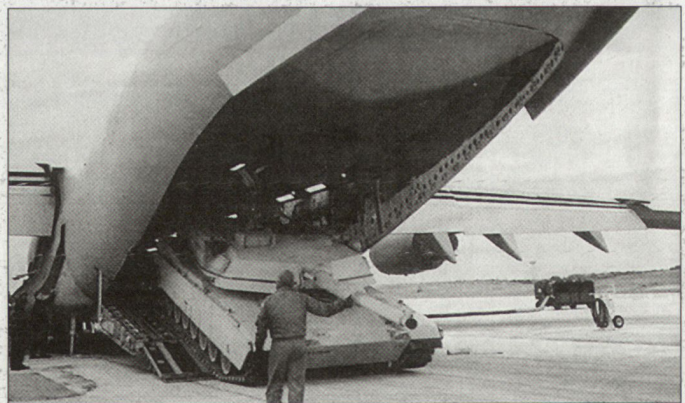
Mangel an Lufttransportkapazität bei den Europäern; im Bild US-Transportflugzeug C-17.

■ Zur technologischen Rückständigkeit der Europäer gegenüber den USA: Diese Unterschiede waren teilweise so gross, dass die Interoperabilität innerhalb der Allianz ernsthaft gefährdet worden war. Gravierend waren bei den Europäern insbesondere die fehlende Führungselektronik und ungenügende Bestände an intelligenten Abstands- waffen. Naumann fordert zur Abhilfe einen verstärkten Technologietransfer der USA nach Europa. Gleichzeitig müssten aber auch die Verteidigungsbudgets bei den europäischen Armeen erhöht werden. Tp