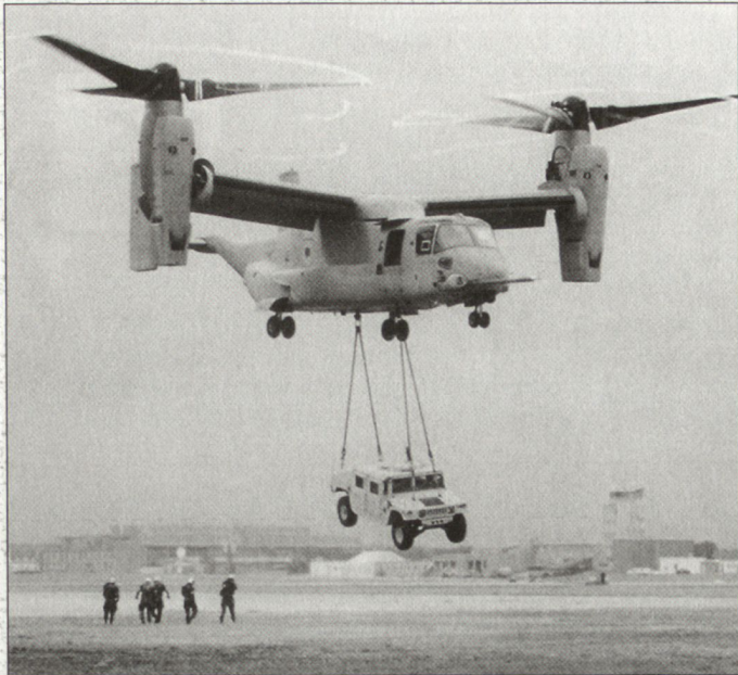
Schwenkrotorflugzeug V-22 geht endlich in Produktion.

ge wurde die Fertigungsentwicklung und die Aufnahme der Produktion immer wieder hinausgeschoben. Vorgesehen ist das Spezialflugzeug mit einer Transportkapazität von 5 bis 7 Tonnen vor allem für Transportbedürfnisse bei Schnellen Ein-