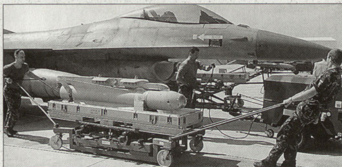
Luftoperation «Allied Force» gegen Restjugoslawien: Aufmunitionierung holländischer Kampfflugzeuge F-16.

Nebst den Amerikanern haben auch die Deutschen, Franzosen und Briten im Zusammenhang