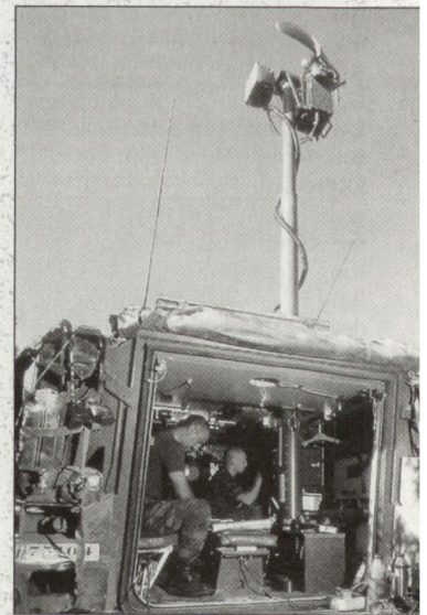
Gefechtsfeldüberwachungsradar der Belgier in Kosovo.

cherheitszone von 5 km (Ground Safety Zone) einhalten. Nebst den vielen anderen Aufgaben ist die KFOR bemüht, die Einhaltung dieser truppenfreien Zone dauernd zu überwachen. Durch die internationalen Truppen werden zu diesem Zweck nebst den gängigen Beobachtungsmitteln auch Wärmebildgeräte, Gefechtsfeldüberwachungsradar sowie Drohnen eingesetzt. hg