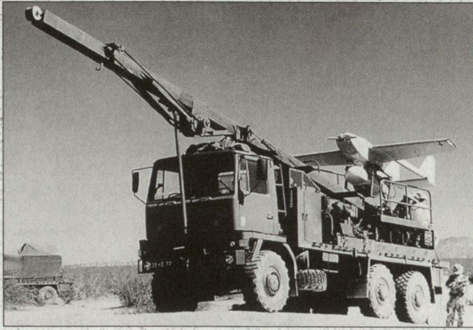
Britisches Drohnensystem «Phoenix» beim Einsatz in Kosovo.

mit der Krise auf dem Balkan zur Informationsbeschaffung Drohnen eingesetzt. Aufklärungskörper vom Typ CL-289 der Bundeswehr hatten während Monaten von Mazedonien aus die Konfliktregion überflogen und die Lage verfolgt, wobei in dieser Zeit auch einige Flugkörper verloren gingen. Die britische Armee ihrerseits hat das Drohnensystem «Phoenix» erstmals im Juni 1999 nach Kosovo in einen Auslandseinsatz verlegt, wobei auch hier die ersten Erfahrungen sehr positiv gewertet werden. Bereits mehr Erfahrung bei der Krisenverfolgung mit solchen Mitteln hat die französische