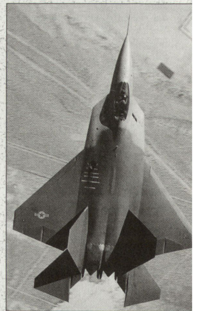
Kampfflugzeugprojekt F-22 der US Air Force; reduzierte Produktionsaufnahme.

Gemäss Rüstungsplanung 2000 werden nun vor allem die Mittel beschafft, die dringend zur Wiederauffüllung der nach der Luftoperation «Allied Force» gegen Jugoslawien stark dezimierten Waffenlager benötigt werden. Darunter fallen diverse Typen moderner luftgestützter Lenkwaffen, Marschflugkörper usw. Zudem werden für die Finanzierung laufender Operationen im Ausland weiterhin grosse Beträge benötigt. hg