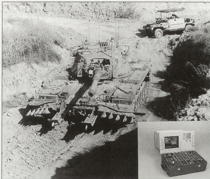
Israelisches Fernbedienungssystem für Kampf Fahrzeuge vom Typ Pele-2000.

seitigung von Minen und Kampfmitteln oder die Durchführung besonders gefährlicher Missionen. Das System Pele-2000 ist modular aufgebaut und kann gemäss Herstellerangaben nachträglich in relativ kurzer Zeit in jedes Gefechtsfahrzeug (in Kampf- und Schützenpanzer) eingebaut werden. Entwickelt und produziert wird Pele-2000 durch die israelische Firmengruppe «Israel Aircraft Industries Ramta Division». Beim