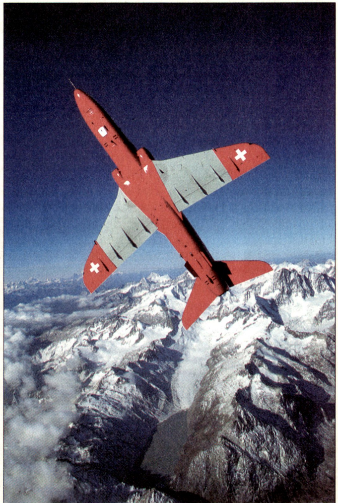
Die Jet-Grundschulung bleibt möglicherweise nicht in der Schweiz. Hier ein HAWK über den Alpen.