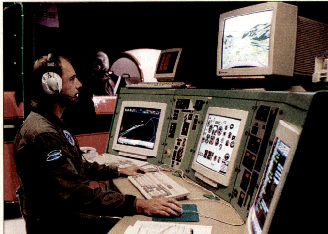
Simulatoren sind nicht mehr wegzudenken; auch die PC-7-Ausbildung wird durch Simulatoren ergänzt.