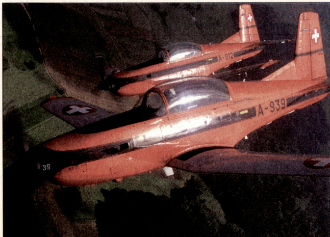
Der Pilatus PC-7 wird auch in Zukunft die Grundlage der Militärpiloten-Ausbildung bleiben.

Das neue Ausbildungskonzept weist folgende Eckwerte auf: