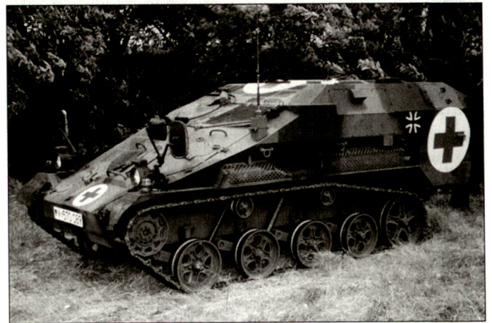
Prototyp des Sanitätsfahrzeuges «Wiesel 2».

Im Rahmen des Einsatzes deutscher Truppen innerhalb der Operation «ESSENTIAL HARVEST» der NATO wurden einige sofortige Beschaffungsentscheide getroffen. Für die sanitätsdienstliche Unterstützung des deutschen Kontingentes in Mazedonien wurden zunächst Sanitätsschützenpanzer «Fuchs» aus dem KFOR-Kontingente in Kosovo abgezogen. Eine Nachbeschaffung von Radschützenpanzern «Fuchs» kann aber