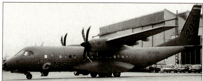
Prototyp des spanischen Transportflugzeugs CASA C-295.

Für den Entscheid zum Kauf von Transportflugzeugen C-295M dürften vor allem wirtschaftliche Gründe massgebend gewesen sein. Evaluiert wurde im Weiteren auch der Kauf von zehn modifizierten Antonov An-32M aus der Ukraine (Angebot der Firmen Antonov und Aviant Kiyev State Aviation Plan). Die ukrainischen Mitbewerber waren allerdings nicht in der Lage, die verlangten Gegengeschäfte resp. die Finanzspritze zugunsten der polnischen Luftfahrtindustrie gewährleisten zu können.