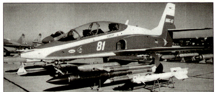
Russisches Schulflugzeug MiG-AT.

Zeit ebenfalls zumindest einige der neuen Trainingsflugzeuge MiG-AT bauen. Angeblich wird die Fertigung von einem Dutzend Maschinen vorbereitet, um bei einem eventuellen Auftrag schnell liefern zu können. Anlässlich der Luftfahrtausstellung in Le Bourget wurde Griechenland als möglicher Kunde genannt. Mikojan hat dabei den Vorteil, dass das Marketing durch Snecma und Thales unterstützt wird, die die Larzac-Triebwerke beziehungsweise grosse Teile der Avionik (Topflight-System) für die Exportversion beisteuern. Sogar der französische Staat greift dem einstigen Gegner unter die Arme. Ein Kredit von 400 Millionen Franc (rund 100 Mio. SFr.) steht für den Serienanlauf zur Verfügung. hg