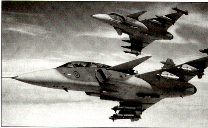
Kampfflugzeuge Jas-39 «Gripen» für Schweden.

die Anschaffung nicht vorhanden. Am 3. Juli 2000 unterschrieben das ungarische Ministerium für Landesverteidigung und die deutsche Firma Daimler Chrysler Aerospace (DASA) eine Absichtserklärung über die Modernisierung von 14 der 27 ungarischen MiG-29, von dem die Regierung aber noch im selben Monat Abstand nahm. Budapest wandte sich im September an die NATO-Staaten, Angebote bezüglich Miete gebrauchter Flugzeuge zu unterbreiten. Im Sinne des Beschlusses des Kabinetts für nationale Sicherheit vom 8. Februar 2001 beschleunigte Budapest die Demontage der russischen Jagdflugzeuge MiG-29. Gleichzeitig wurde das Ministerium für Landesverteidigung beauftragt, mit Washington Verhandlungen über die Miete von 24 Jagdflugzeugen F-16 zu beginnen (siehe auch ASMZ 1/2000, Seite 34/35). Das Ministerium für Landesverteidigung schloss den Vergleich der eingegangenen Angebote – zwischen amerikanischen, belgischen, türkischen F-16 und dem schwedischen Gripen – am 4. September ab.