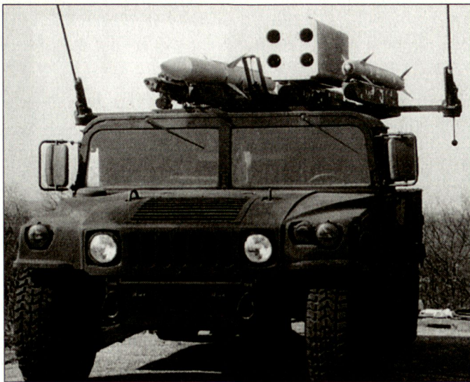
Versuchsfahrzeug für das künftige Flabsystem «CLAWS».

AIM-120 «AMRAAM» (Advanced Medium Range Air-to-Air Missiles) genutzt. Das neue Flab-System soll die beim Marine Corps heute eingesetzten taktischen Flab-Lenkwaffensysteme «Avenger» ergänzen, die mit Lenkflugkörpern «Stinger» ausgerüstet sind. Die Waffensysteme «CLAWS» sollen auch gegen moderne Bedrohungen wie gegen Marschflugkörper oder auch gegen unbemannte Flugkörper einsetzbar sein.