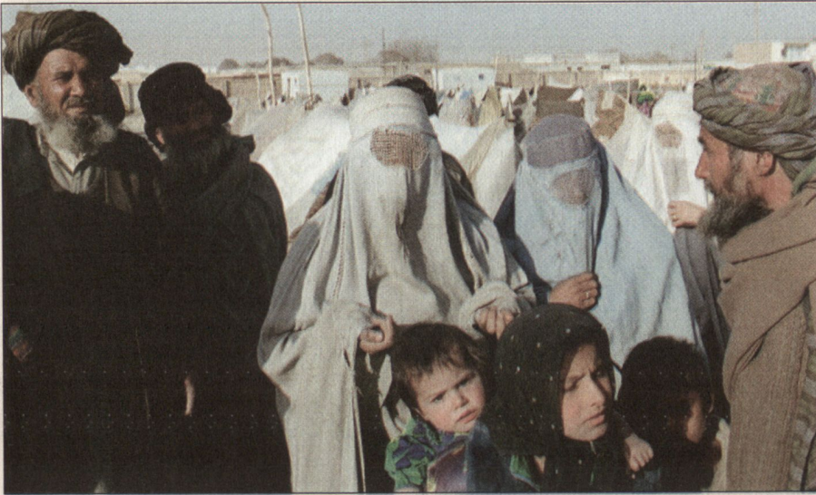
Mit der Tragepflicht der Burka haben die Taliban eine paschtunische Tradition wieder belebt.