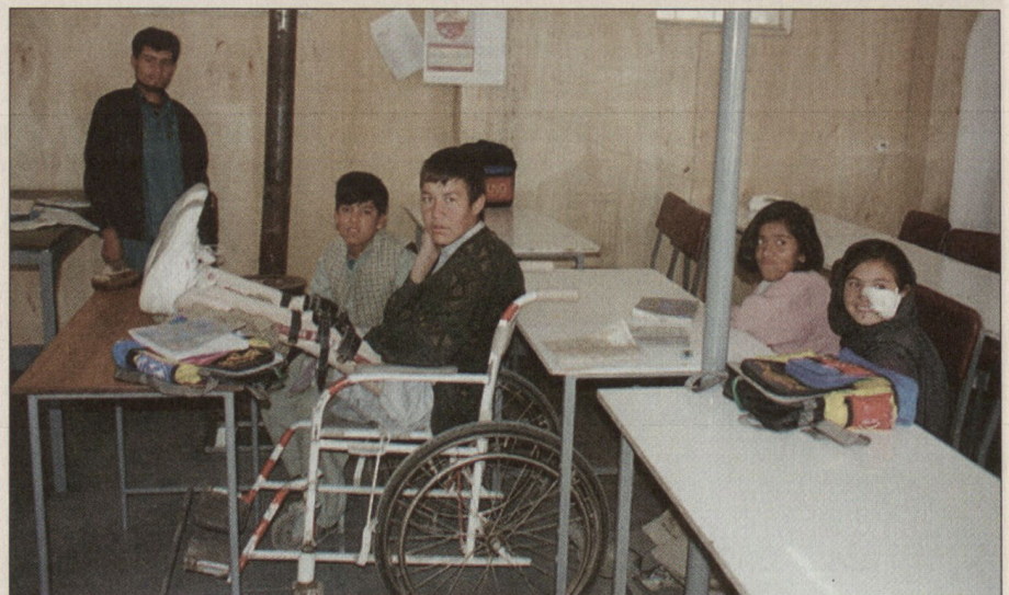
Auch heute noch erleiden in Afghanistan täglich Dutzende von Personen schwerste Verletzungen durch Personenminen.

Die Gesellschaft, insbesondere auf dem Lande, basiert auf Familien- und Clanstrukturen mit einer absoluten Vorherrschaft der Männer. Diese sowie die zwanzigjährige Kriegsgeschichte, nicht nur gegen Aggressoren von aussen, sondern auch wegen Fehden, haben Land und Volk jegliche Entwicklungsmöglichkeit verbaut. Zwar gibt es eine gut gebildete Schicht. Ein an der Technischen Universität Berlin ausgebildeter Ingenieur steht heute im IKRK-Zentrum für Orthopädie an der Drehbank, ein von den Russen zum Chemiker ausgebildeter Mann muss heute als Ad-hoc-Dolmetscher den Lebensunterhalt für sich und