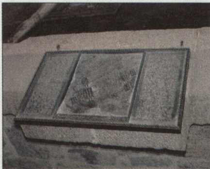
Die Darstellung der Schlacht.

Am 15. (28.) Juni 1398 siegte ein osmanisches Heer unter Sultan Murad I. (1362 bis 1389) über eine verbündete Armee, die durch den serbischen Fürsten Lazar geführt wurde, auf dem Amselfeld (Campus Turdorum, Kosovo Polje). Dieser wurde nach seiner Gefangennahme an der Bahre des gefallenen Sultans hingerichtet. Nach dieser verlorenen Schlacht geriet Serbien in die Abhängigkeit der Osmanen als tributärer Staat. Erst 1459 wurde Serbien aber durch die Osmanen in ihr Imperium als Provinz eingegliedert. Die adlige Oberschicht wurde, sofern sie nicht in das heutige Serbien, den Raum um Belgrad, floh, hingerichtet. Mit ihren Gegnern kannten die Osmanen kein Erbarmen. 1521 eroberten die Osmanen Belgrad. In späteren Jahrhunderten kam es zu weiteren Vertreibungen der Serben aus dem Kosovo und dem heutigen Serbien. Ein grosser Teil der serbischen Bevölkerung floh 1737 in das habsburgische Banat. Durch die verschiedenen Vertreibungen wurde in den Jahrhunderten der Anteil der serbischen Bevölkerung im Kosovo vermindert.