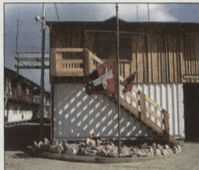
Das Camp der Swisscoy.

Beitrag zur Beruhigung der Lage in diesem Land zu leisten. Die KFOR hat aber nicht genügend Mittel, um jederzeit die Grenze überwachen zu können. Da der Waffenschmuggel in der Nacht auf unwegsamen Gebirgspfaden mit Maultieren erfolgt, wird die Grenze von Zeit zu Zeit durch Artilleriegranaten beleuchtet.