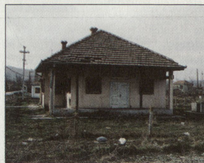
Ein serbischer Bauernhof bei Pristina.

Nach wie vor leistet die Swisscoy in verschiedenen Bereichen –Transportleistung zugunsten der KFOR, Wasseraufbereitung für das Camp Casablanca – eine hervorragende Arbeit. Neben den Funktionen im Rahmen der Swisscoy könnten durch Schweizer Offiziere im Stab der MNBS weitere interessante Funktionen ausgeübt werden. So zum Beispiel in der Operationszentrale. Leider entsprechen die schweizerischen Entschädigungen nicht in je-