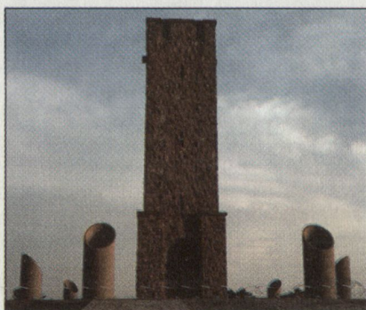
Das serbische Denkmal auf dem Amselfeld.

dem Fall jenen der deutschen und österreichischen Kameraden. Ein Schweizer AdA erhält einschliesslich der Zulagen pro Monat SFr. 5150.–. Nicht nur ist dieser Betrag steuerpflichtig, die nicht ausbezahlte Entschädigung für Kost und Logis von SFr. 600.– muss auch versteuert werden. Der deutsche Soldat (Hauptgefreiter) erhält mit den Zulagen pro Monat SFr. 6525.–. Die Zulagen sind steuerfrei. Dazu kommt noch der 13. Monatslohn, der bei den Schweizern nicht ausbezahlt wird. Der österreichische Soldat, allerdings bei einer tieferen Kaufkraft, erhält SFr. 4365.–. Auch hier sind die Zulagen steuerfrei und die Sozialversicherung wird vom Staat bezahlt. Der Schweizer muss 7,5% auf allen Beiträgen bezahlen. Ähnlich sieht auch die Situation bei den Pensionskassen aus. In Deutschland übernimmt der Staat die Pensionskasse und die Krankenkasse für die Soldaten. Die Schweiz bezahlt für die Familien keine Pensionskassen. In Anbetracht dieser finanziellen Unterschiede und der Leistungen der Schweizer Soldaten im Kosovo drängen sich Sofortmassnahmen auf. So müssen die Grundgehälter der Swisscoy-Angehörigen der Marktsituation angepasst und die Zulagen von der Steuer befreit werden.